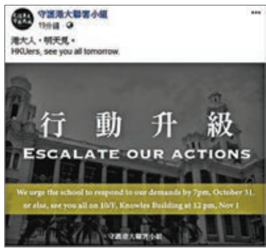
「守護港大聯署小組」昨晚宣佈行動升級，日前更曾揚言不排除「裝修」(打砸)港大。

百年校園隨時遭受暴徒「裝修」破壞，網民均表示憤慨。「Chueng Luk」狠批：「厲害了！要挾、恐嚇咁都得，若校長回應就係向暴力低頭，認可暴力可為一切！」「onnieccc」則指：「港大唔企硬只會令校風敗壞，往後幾屆畢業生受僱主唾棄，中大就係好例子！」