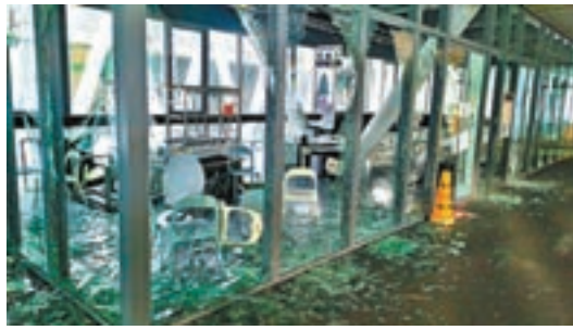
知專學院校園早前被暴徒大肆破壞，落地玻璃盡碎。

有關人等口口聲聲形容行動是「爭取校長對同學的關心」，惟明眼人都能看出這是暴力威脅，港大