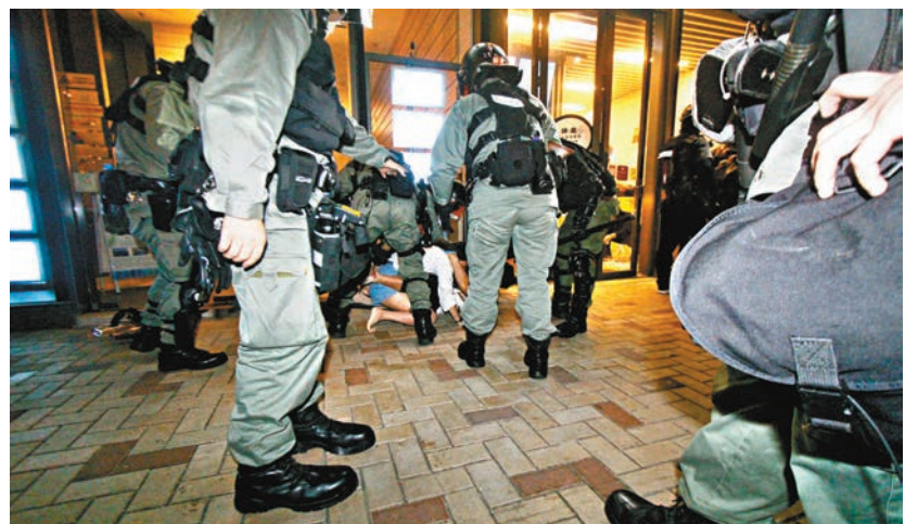
▲防暴警察拘捕多名涉嫌非法集結或阻差辦公的人。

香港文匯報訊(記者 蕭景源)屯門黑衣魔和擲暴「街坊」，前日連續第三晚大鬧社區及襲擾警署，60名防暴警出動胡椒彈追捕滋事分子。有黑衣魔和街坊裝扮的男女逃入食肆和屋苑大廈作避風港，企圖逃避警方追捕，不過防暴警鏢而不捨在屋苑截停疑犯，截至昨晨，警方拘捕至少60人，包括涉阻差辦公的一間食肆負責人姊弟。