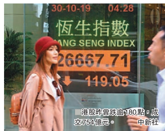
香港文匯報訊(記者 周紹基)市場憂慮中美11月或未能簽署首階段貿易協議,港股連跌兩日,昨在期指結算日,曾跌逾180點。尾市跌幅收窄至119點報26,667點,成交754億元。