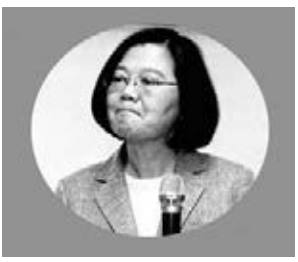
看看她嘴臉。 作者提供

應，倒是YouTube網友留言紛紛噓她：「斷七國，別人做不到小英做到了！」「專機超買一萬多條私煙，別人做不到小英做到了！」「空心菜」應知民心所向。 看看她嘴臉。 作者提供