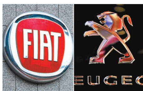
快意與標緻計劃合併。