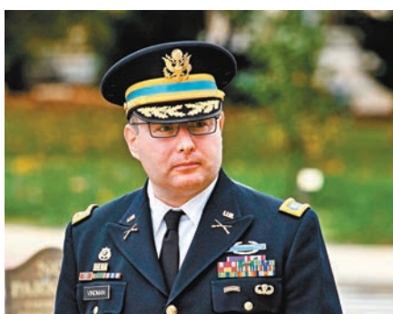
溫迪曼到場作證。

由於溫迪曼曾親身聽取美烏元首通話，其證詞被視為更具殺傷力。特朗普在twitter狠批溫迪曼，形容他為「永不支持特朗普的人」(Never Trumper)，直斥「他聽的真的是和我一樣的通話嗎？沒可能！」部分共和黨右翼人士亦以溫迪曼的出生地大做文章，聲稱他在前蘇聯時期於烏克蘭出生，愛國情操令人懷疑。