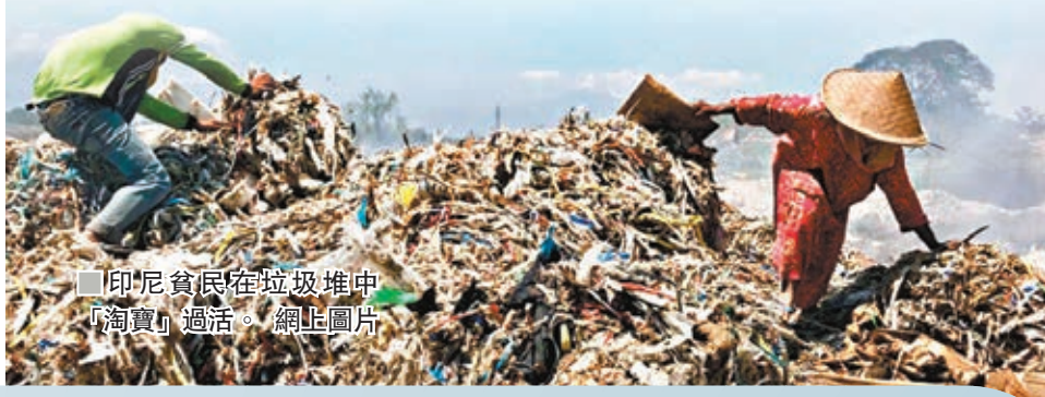
印尼貧民在垃圾堆中「淘寶」過活。