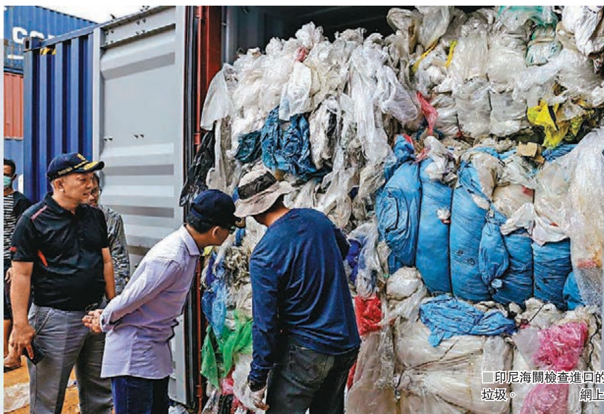
印尼海關檢查進口的塑膠垃圾。