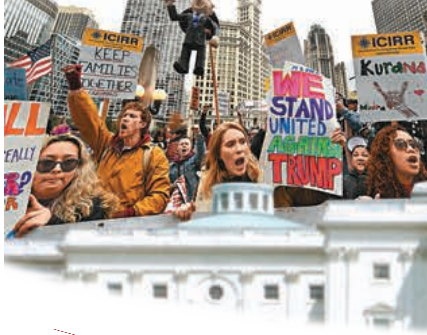
■眾議院將表決是否繼續對特朗普進行彈劾調查。