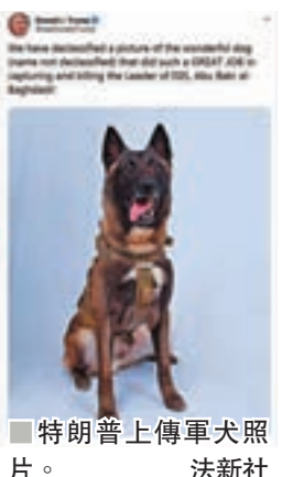
■特朗普上傳軍犬照片。法新社

的所在地和名稱。「美國軍犬協會」主席艾洛表示，比利時瑪連萊軍犬一般負責為軍隊帶路、保護軍人、搜捕敵軍以及尋找炸彈，讚揚這品種的軍犬能幹和聰明，能積極執行命令，往往被派到前線作戰。艾洛又指出，不公開軍犬的名字是為防止牠被報復，「就像不公開參與行動的士兵身份一樣。」