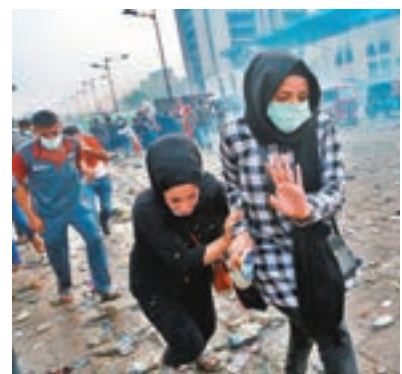
■婦人躲避催淚氣體。