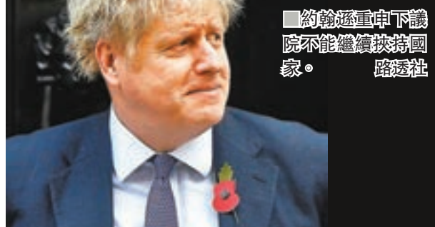
約翰遜重申下議院不能繼續支持國家。