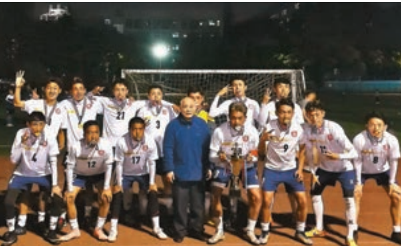
■「德吉杯」奪冠後，藏生與楊阿爸合影。

不能在西藏工作一輩子，就在武漢繼續為西藏的發展出力。與武漢大學一路之隔的武漢水利水電學校設有西藏班，兩人經常去慰問幫助藏族學