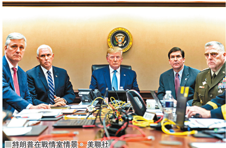
■特朗普在戰情室情景。