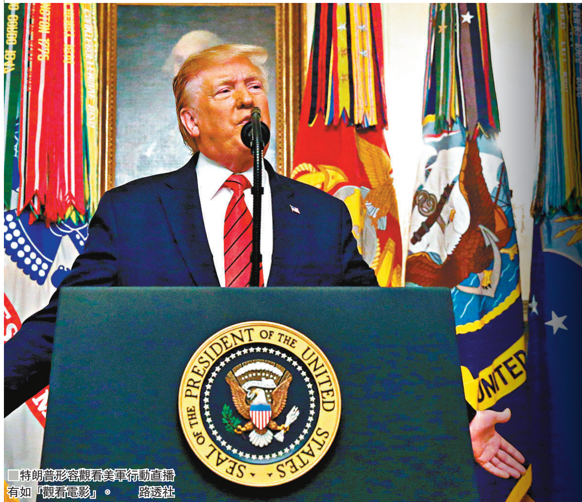
■特朗普形容觀看美軍行動直播有如「觀看電影」。

美軍特種部隊成功迫使極端組織「伊斯蘭國」(ISIS)領袖巴格達迪自爆身亡，美國總統特朗普隨即趾高氣揚地大肆邀功。不過《紐約時報》報道，伊拉克和敘利亞庫爾德族一直參與追緝巴格達迪，但特朗普明知行動籌備進度，卻仍執意在這時刻下令美軍撤出敘利亞北部，背棄庫族盟友，打亂全盤部署。