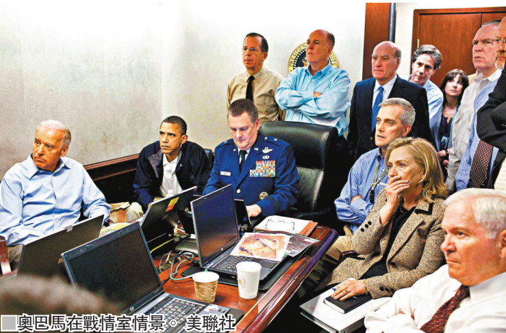
■奧巴馬在戰情室情景。