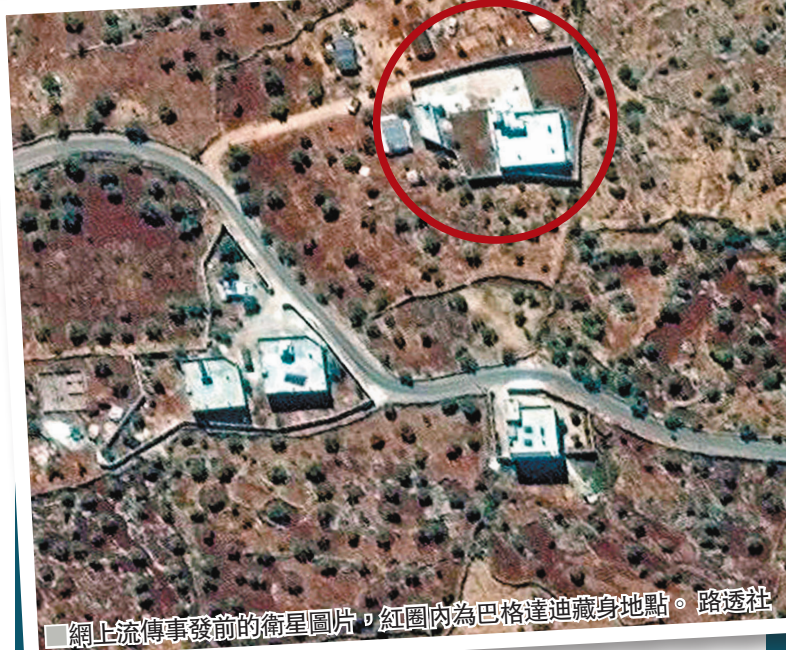
■網止流傳事發前的衛星圖片，紅圈內為巴格達迪藏身地點。