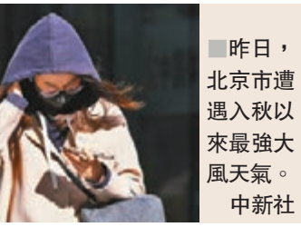
昨日，北京市遭遇入秋以來最強大風天氣。中新社

數據顯示，2009年到2018年10月下旬觀象台大風、沙塵日數均為0天，本次同時出現的大風、沙塵天氣過程為近