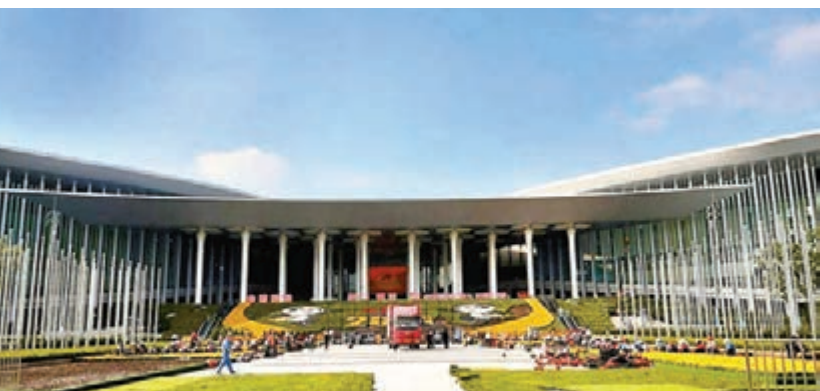
第二屆進博會會場裝飾施工工作正在進行中。