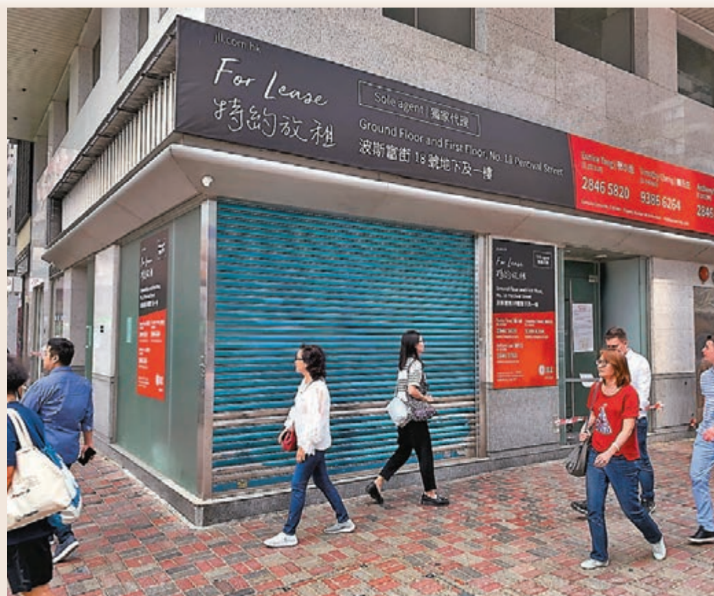
受內外因素綜合影響,本港市民消費意慾下降,各行各業的生意大受影響,導致商舖放頂租個案持續上升。

香港文匯報訊(記者蔡競文)受本港暴力示威活動影響,零售業表現疲弱,商舖頂租放盤個案有上升趨勢。據美聯工商舖資料研究部及美聯旺舖資料顯示,本月截至21日,該行錄得商舖頂租放盤個案145個,比8月尾的數據增加15個,升幅為11.5%。該行認為,社會風波仍然未平息,料將繼續影響零售業,尤以飲食業最為嚴重,預料未來數月放頂租個案仍會上升。