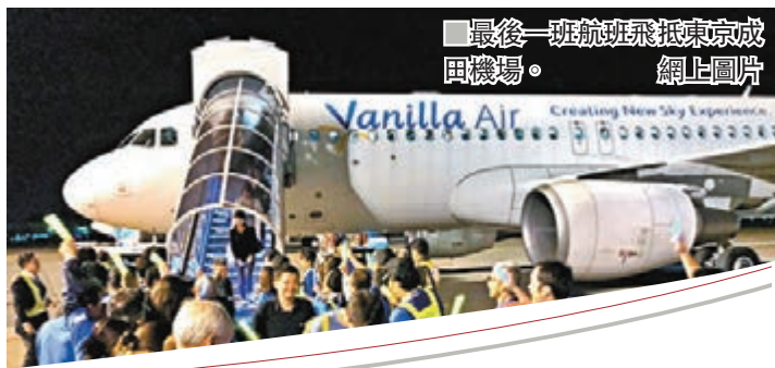
最後一班航班飛抵東京成田機場。網上圖片