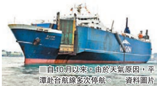
自10月以來，由於天氣原因，平潭赴台航線多次停航。資料圖片

香港文匯報訊 據中新社報道，27日，除中南部沿海部分縣市最低氣溫仍在20℃以上外，福建大部分縣市都在20℃以下，南平、三明、寧德部分高海拔山區最低溫度在13℃至15℃之間。