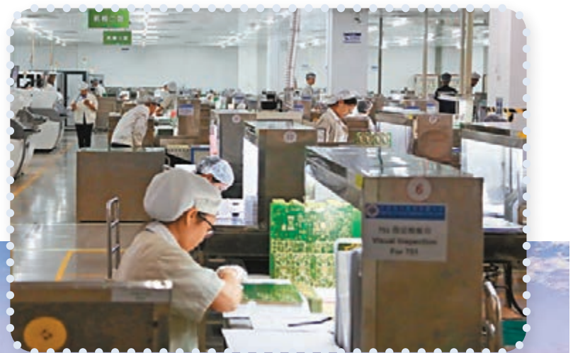
▼ 東莞以生產供應鏈齊全備受青睞。圖為該市一間電路板生產企業的生產業線。