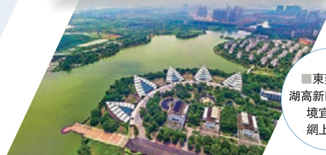
■ 東莞松山湖高新區生活環境宜人。