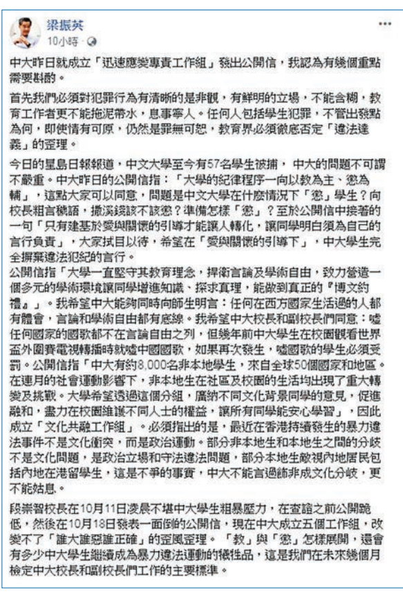
■ 梁振英批評段崇智在發信前並無向警務人員求證,對警務人員不公平。fb截圖

程序而行,……段校長並沒有偏聽一面之詞,在信中一再重複使用『在查明細節後』及『經查證後』等字眼,足見其小心謹慎的處事態度」云云。 梁振英在fb發帖反駁煽暴派。他在帖中形容,煽暴派稱「段校長並沒有偏聽一面之詞,在信中一再重複使用『在查明細節後』及『經查證後』等字眼,足見其小心謹慎的處事態度」是「徹底的廢話」,「因為段校長是先有結論(出聲明譴責警方暴力),後有所謂『查明細節』和『經查證後』。」 梁振英質問,段崇智在10月10日會見學生至10月18日發公開信之間的7天內,「段校長或中大其他管理人員有向警務人員求證嗎?如果沒有,聽信片面之詞就是『查明』『查證』嗎?這樣對警務人員公道嗎?這是教導學生的良好示範嗎?」 在學生粗暴壓力下就範投降 他續指,段崇智在10月10日會見中大學生,被辱罵為「段狗」,有人更跳上枱面向他撒錢,更阻止他離開。其後,段崇智和學生閉門會面至凌晨後,中大校方就說會出聲明「譴責警方暴力」,「段校長當晚受學生壓力之下(包括),態度180度轉變,這是不爭的事實。……是在學生粗暴壓力下就範投降,代表中大屈服在『誰大誰惡誰正確』的歪風歪理之下。」 針對煽暴派議員引用段崇智信中稱「作為師長,我們必須教導同學為自己的言行負責」,梁振英質疑道:「10月10日晚