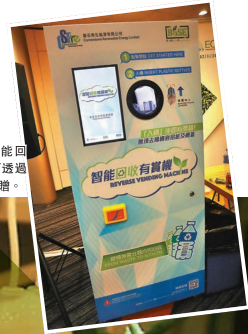
2合1智能回收有賞機可透過八達通作回贈。