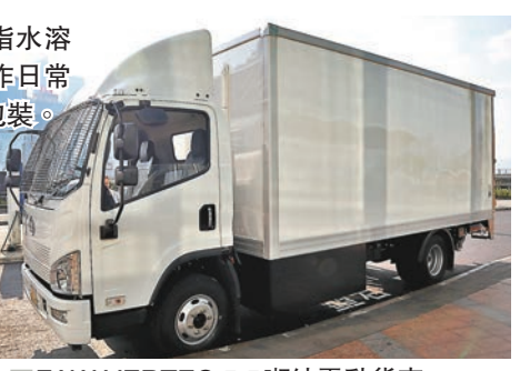
FAW VERTEC 5.5噸純電動貨車。