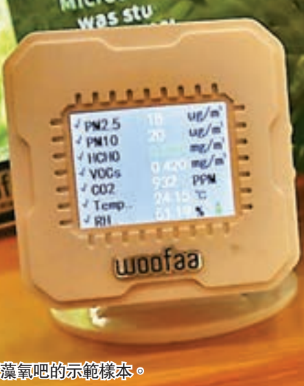
智能水藻氧吧的示範樣本。

香港貿易發展局署理總裁周啟良早前於國際環保博覽記者會上表示：「環保產業獲廣泛認為一個極具增長潛力的行業，於經濟持續發展中扮演一個重要的角色，是次博覽旨在促進不同國家及地區的環保及相關業界合作和交流，把握最新綠色商機之餘，同時攜手實踐低碳經濟及生活。」博覽的最後一天（11月2日）為公眾日，當天會免費開放給公眾入場參觀，「環保工作坊」亦會於公眾日舉行，教授市民製作環保摺紙及印花環保袋。