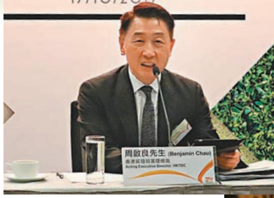
香港貿易發展局署理總裁周啟良介紹國際環保博覽活動內容

香港貿易發展局署理總裁周啟良早前於國際環保博覽記者會上表示：「環保產業獲廣泛認為一個極具增長潛力的行業，於經濟持續發展中扮演一個重要的角色，是次博覽旨在促進不同國家及地區的環保及相關業界合作和交流，把握最新綠色商機之餘，同時攜手實踐低碳經濟及生活。」博覽的最後一天（11月2日）為公眾日，當天會免費開放給公眾入場參觀，「環保工作坊」亦會於公眾日舉行，教授市民製作環保摺紙及印花環保袋。