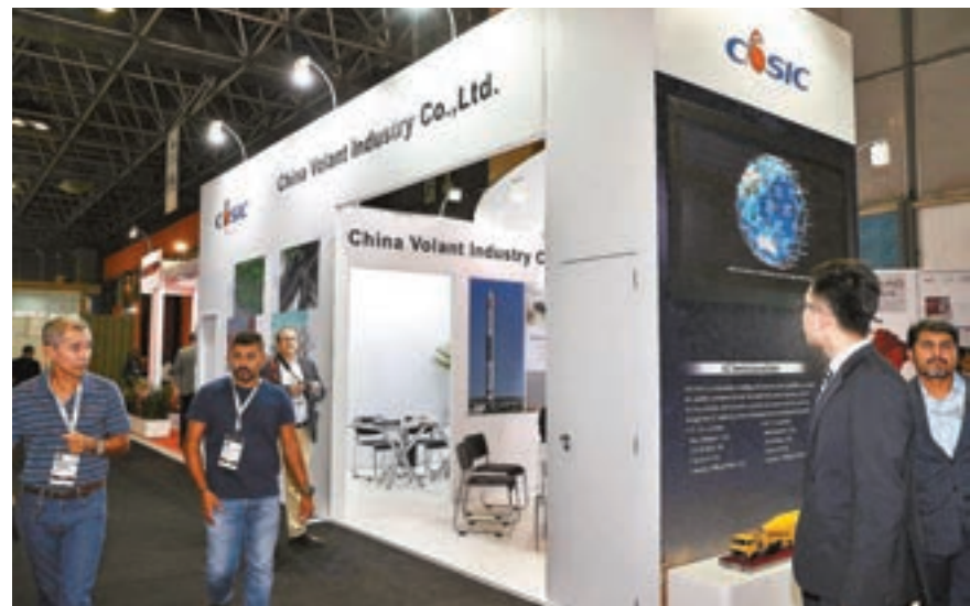
巴西總統表示歡迎中國企業來巴西投資。圖為早前在巴西里約熱內盧舉行的巴西防務展，中國企業通過參加展會積極開拓市場。資料圖片

用。會談後，兩國元首共同見證了多項雙邊合作文件的簽署。訪問期間，兩國還發表了《中華人民共和國和巴西聯邦共和國聯合聲明》。會談前，習近平在人民大會堂東門外廣場為博索納羅舉行歡迎儀式。楊潔篪、王東明、王毅、陳曉光、何立峰等參加。