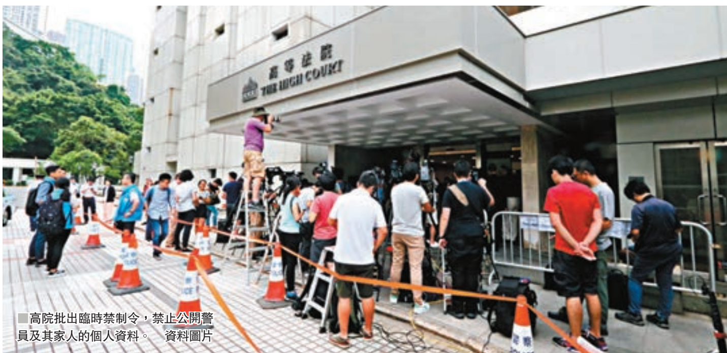
高院批出臨時禁制令,禁止公開警員及其家人的個人資料。資料圖片