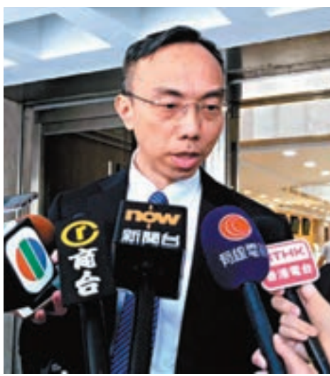
律政司副民事法律專員李錦耀在庭外接受訪問。