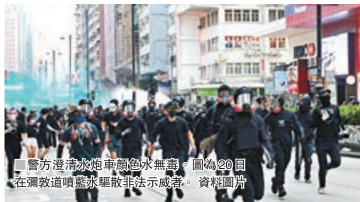
警方澄清水炮車顏色水無毒。圖為20日在彌敦道噴水驅散非法示威者。資料圖片

警方昨日回覆媒體查詢表示,警方決定使用「人群管理特別用途車」(通稱水炮車)時,會按實際情況加入顏色水及催淚水劑,而催淚水劑的效用與胡椒噴劑相若,會令人感到短暫不適,但對人體不會造成永久影響;至於顏色水為一種無毒的顏色物料,對人體無害,亦不會對公眾健康構成風險。警方續指,使用顏色水的目的,是令示威者的衣物及身體表面被染上顏色,以便協助警方辨識該人是否曾於現場出現;而使用催淚水劑能有效令示威者停止攻擊行為,以及協助警方驅散行動。警方強調,任何人沾染催淚水劑,應即時離開現場,並於空氣流通地方,用大量清水沖洗受影響的身體部位,有關影響應於10至15分鐘內開始消散。