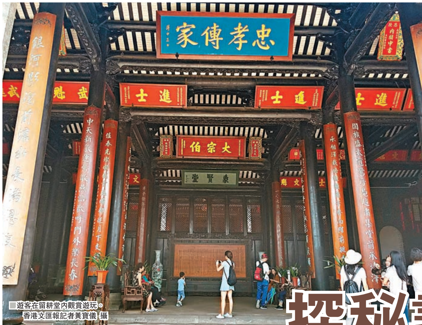
遊客在留耕堂內觀賞遊玩。