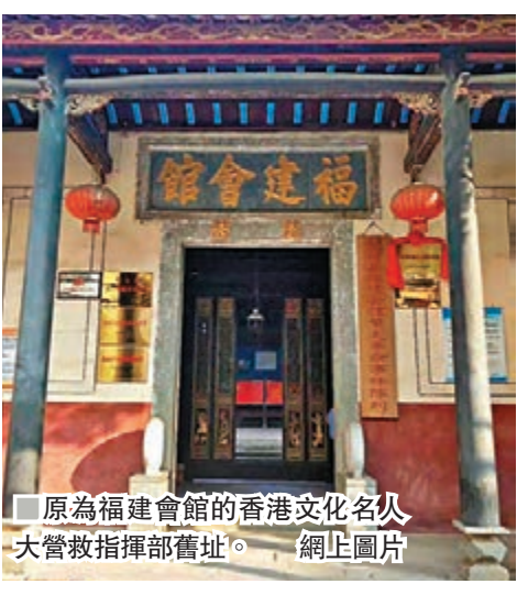
原為福建會館的香港文化名人營救指揮部舊址。網上圖片

在香港的發展歷史中，很多人和事，都印證着香港與內地緊密相連，唇齒相依的關係，被茅盾稱之為「抗戰以來最偉大的搶救工作」的中國文化名人香港大營救正是其中之一。70多年前，香港淪陷，廖承志、何香凝、柳亞子、鄒韜奮、茅盾、夏衍、胡蝶、千家駒、蔡楚生、喬冠華、廖沫沙、胡風、丁聰……300多名困居港九的文化名人，在中共中央南方局和八路軍駐香港辦事處的幫助下，穿過日軍封鎖線，沿東江溯流而上，轉移到安全的大後方。