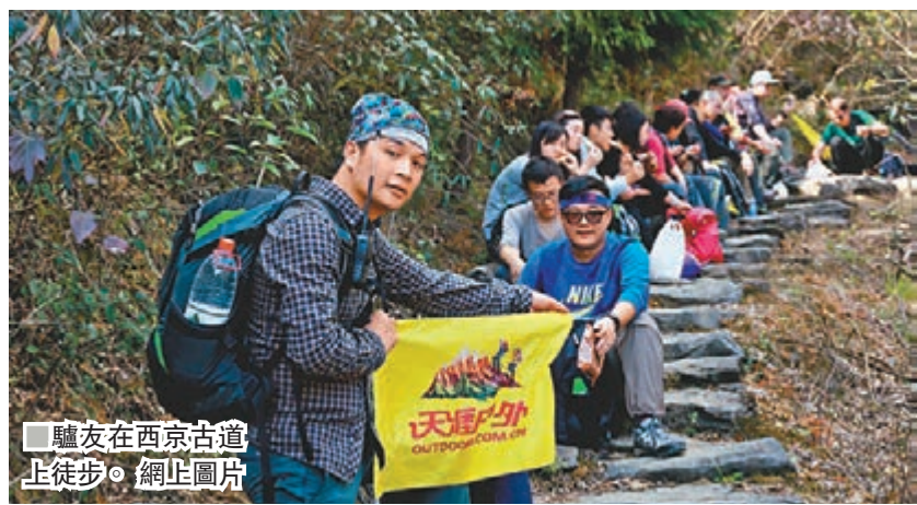
驢友在西京古道 上徒步。