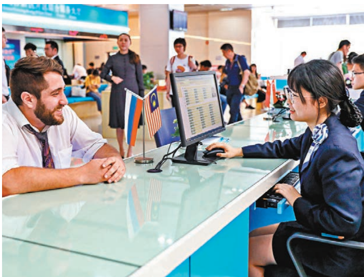
國務院公佈《優化營商環境條例》，自2020年1月1日起施行。圖為廣州市南沙區政務中心設立的涉外綜合服務平台。資料圖片