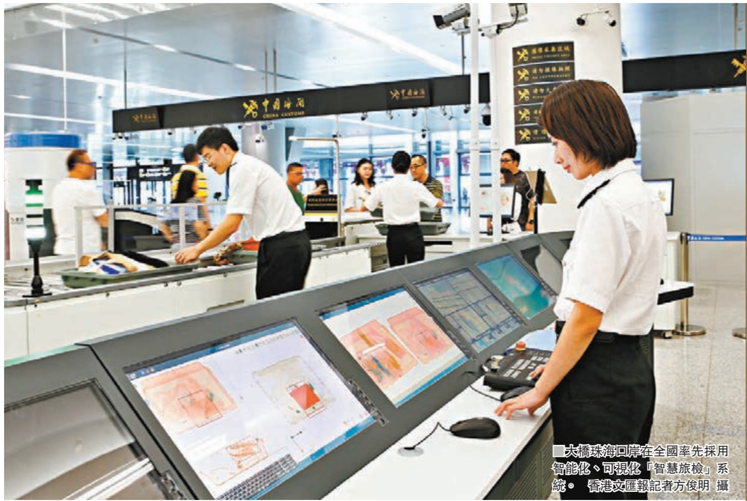
大橋邊檢口岸在全國率先採用智能化、可視化「智慧旅檢」系統。

香港文匯報訊（記者 方俊明 珠海報道）港珠澳大橋迎來通車一周年。作為粵港澳三地首個共建共治共享的跨境大型基礎設施項目，港珠澳大橋集成了「一國兩制」的制度優勢。大橋管理局有關負責人指出，大橋建設管理模式是一種體制機制創新，推行「多主體協同運營」的管理模式，有效解決了三地法律法規差異、技術標準銜接、建設程序規範、思維模式碰撞。比如，大橋珠澳口岸人工島的旅檢大樓，是目前全國唯一的三地互通邊檢口岸，有序運行着被稱作「合作查驗、一次放行」的新型邊檢查驗模式。