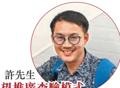
許先生望推廣查驗模式

曾從雲浮到香港迪士尼，經大橋出行較原來經深圳引入香港節省了超過一半時間。期待更多類似大橋等工程建設，加快助力大灣區「一小時生活圈」真正成形。