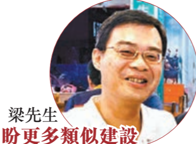
梁先生盼更多類似建設

曾從雲浮到香港迪士尼，經大橋出行較原來經深圳引入香港節省了超過一半時間。期待更多類似大橋等工程建設，加快助力大灣區「一小時生活圈」真正成形。