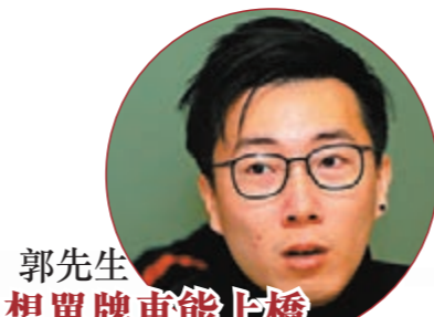
郭先生想單牌車能上橋

相比粵港澳其他口岸，大橋珠澳口岸採用「合作查驗、一次放行」新型查驗模式，非常便捷；期待該模式能逐步擴展到其他口岸，讓大灣區城市群之間出行和交流更加暢通。