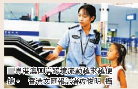
港珠澳口岸跨境流動越來越便捷。

成果化經驗 推廣全灣區 該負責人分析說，作為全球最長的跨海大橋，港珠澳大橋長55公里，需要利用智能化、人工智能技術、信息技術等手段，將原來需要靠人工檢測、運維的工作，交給智能化設備實施，這樣大橋的「保健」條件會更好。譬如，利用無人飛機、無人潛艇、無人船等對大橋進行水上、水下的檢測和維護。