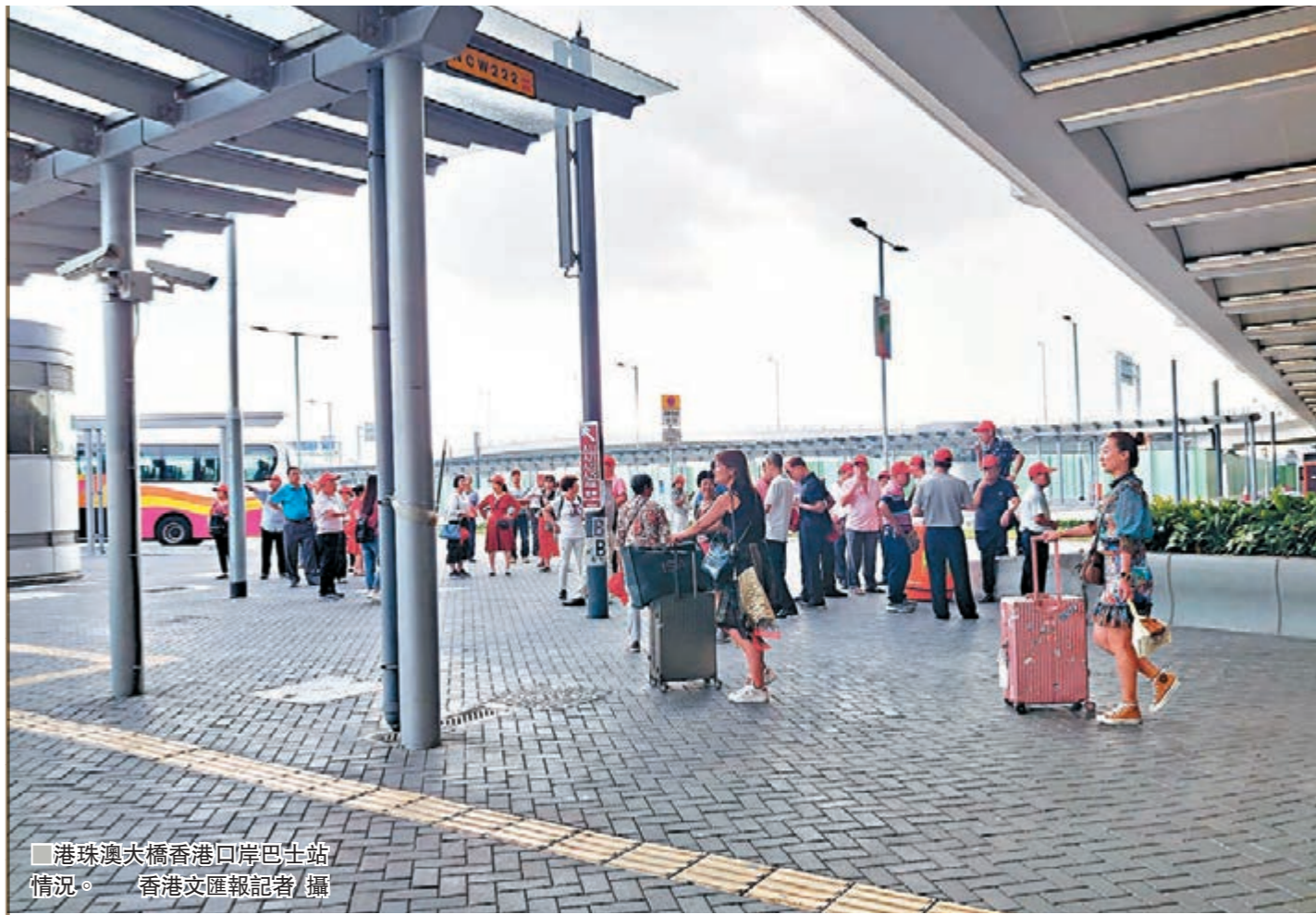
港珠澳大橋香港口岸巴士站情況。

大橋和高鐵的通車，有助香港積極發揮國際旅遊中心的角色，推動「一程多站」旅遊。但受近月社會事件影響，訪港旅客比去年同期明顯下跌。政府會繼續支持旅發局的推廣工作，旅發局將於適當時間聯同業界，在客源市場展開大規模宣傳推廣，令旅客重拾來港旅遊的信心。