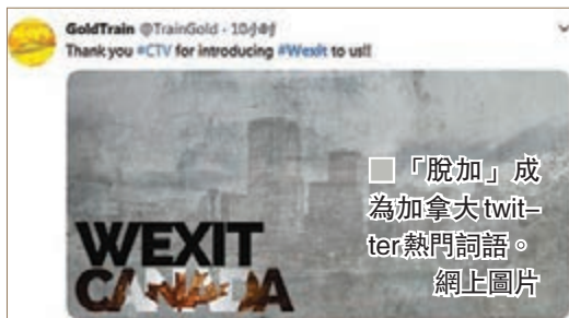
「脫加」成為加拿大twitter熱門詞語。

薩斯喀徹溫、艾伯塔、馬尼托巴與卑詩4個西部省份，在地理上遠離渥太華及蒙特利爾等政經中心，當地民眾長期感覺被聯邦政府忽視，例如油產豐富的艾伯塔，為加拿大國內生產總值(GDP)貢獻17%，但國會議席僅佔10%。而在杜