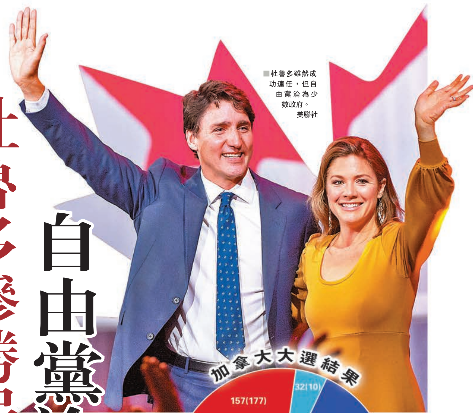
杜魯多雖然成功連任，但自由黨淪為少數政府。