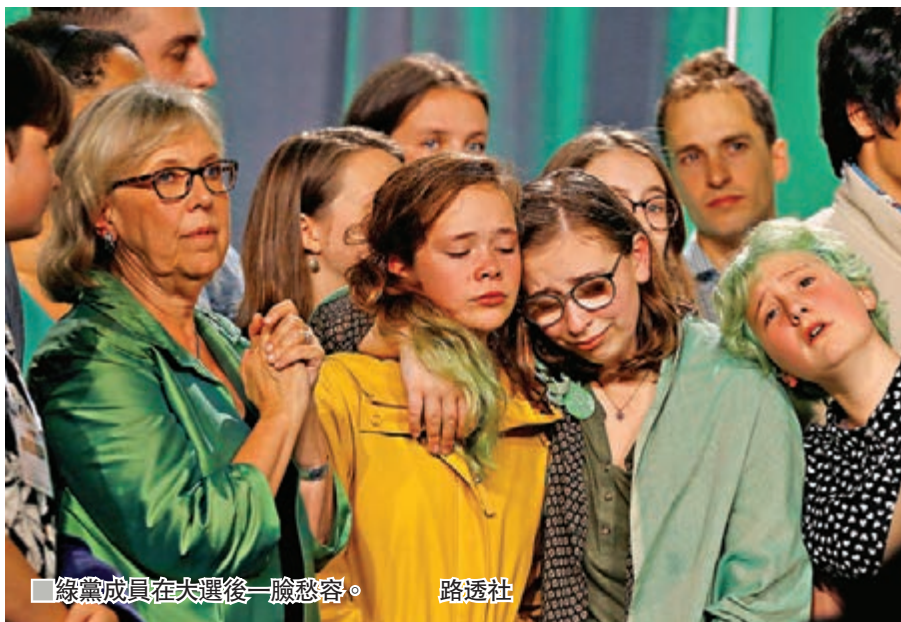
綠黨成員在大選後一臉愁容。

與其他議會制國家相比，少數政府在加拿大並不罕見，過去15年間便出現過3次少數政府，相反多黨聯合政府卻只在2008年出現過。加拿大少數政府的壽命一般不會長過兩年半，有自由黨高層估計，鑑於不少現任議員起碼要多做兩年才能獲得議員退休金資格，因此新一屆政府起碼可以在未來兩年內暢順執政。