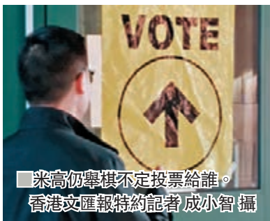
米高仍舉棋不定投票給誰。