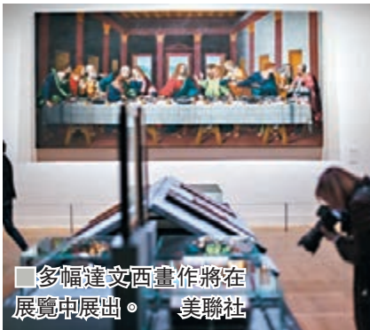
多幅達文西畫作將在展覽中展出。