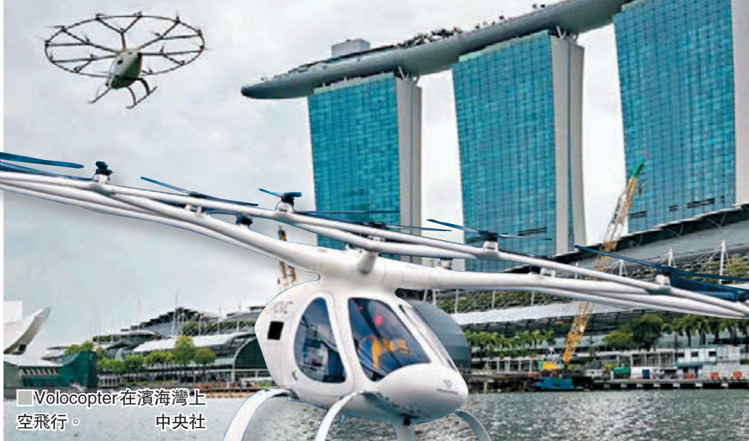
Volocopter在濱海灣上空飛行。