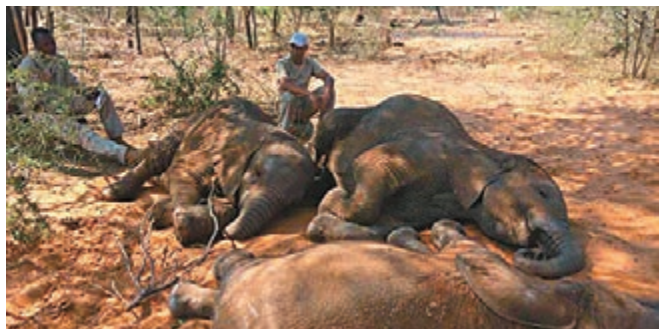
津國多頭大象因缺水死亡。