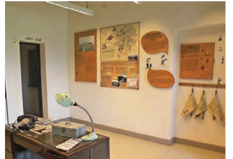
■主樓的部分地方開放參觀。

築巢之地。此處鸞鳥品種繁多，據觀鳥會的數字統計，截至去年，已有超過150個鳥巢。再加上警署內的「古樹名木」及數十棵大樹，所以，在活化之餘要保育整個生態環境才是最大挑戰。因此，在活化之前，嘉道理農場已經先進行了生物多樣性的普查，施工過程中，建築團隊亦會盡量避開鳥類繁殖的季節。