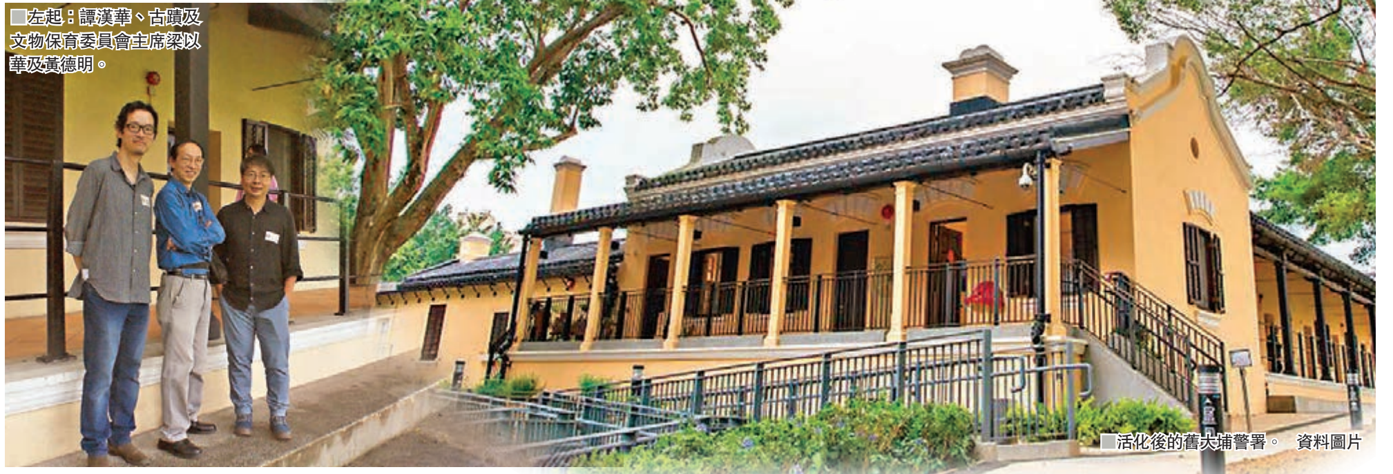
■活化後的舊大埔警署。