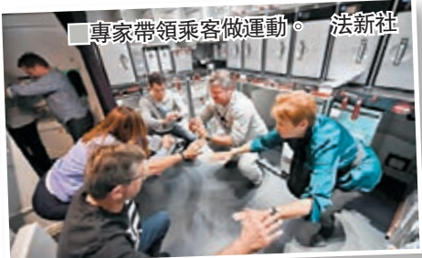
■專家帶領乘客做運動。

澳洲航空公司一班客機昨日成功由美國紐約直接飛抵澳洲悉尼，全程長達19小時16分鐘，刷新世上最長直航航班紀錄。澳航希望透過今次試飛，分析長時間飛行對乘客及機組人員的影響，最終為這條航線投入商業運作鋪路。