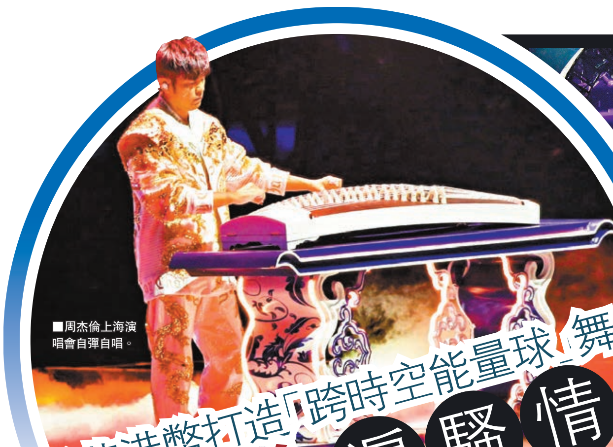
■周杰倫上海演唱會自彈自唱。