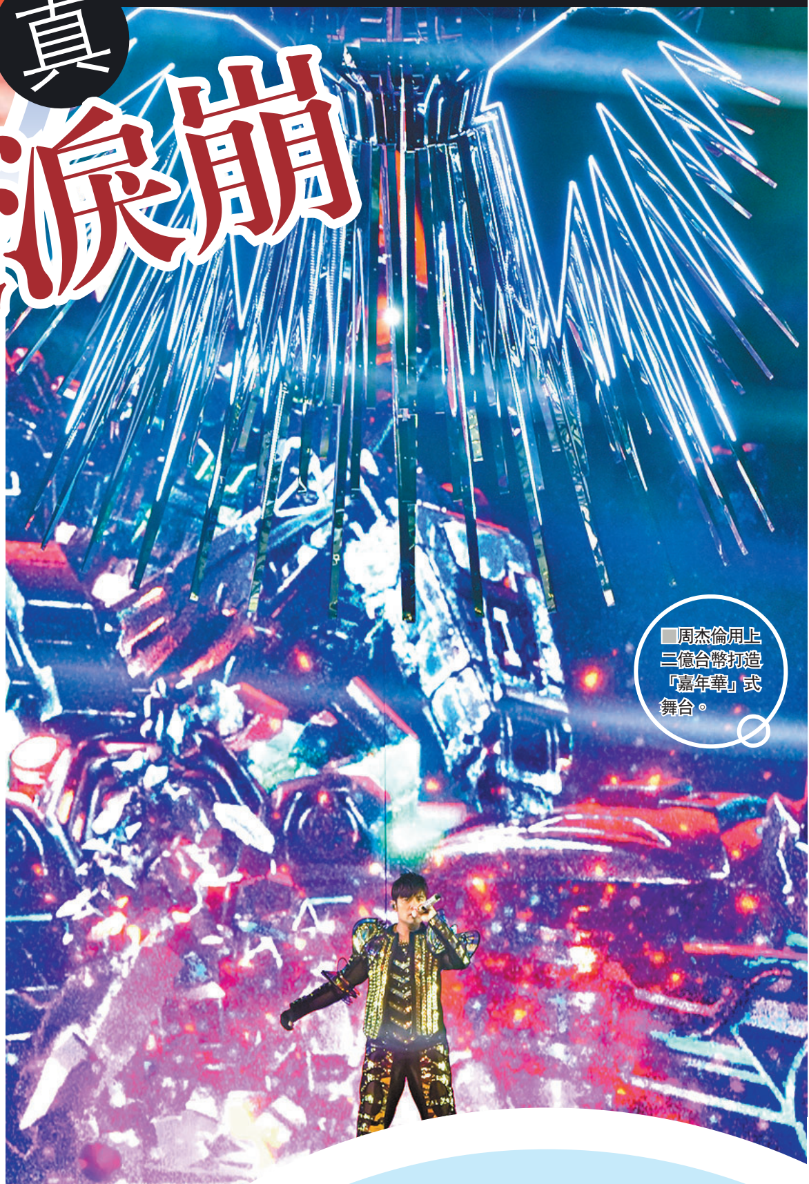
■周杰倫用上三億台幣打造「嘉年華」式舞台。

至於演唱會商品區售賣多樣新潮的服飾配件，還有「嘉年華水晶球」，內置的金屬旋轉木馬，還有特別限量推出的「告白氣球」旋轉音樂盒，均讓歌迷愛不釋手！