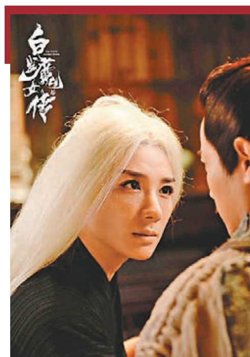
■內地女星黃奕最近正忙於拍攝電影《白髮魔女傳》。