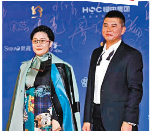
名導李少紅(左)也現身福州。

當晚晚會以電影對話為主線,串聯中國精神、紅色傳承、「一帶一路」三大主題。中國精神主題電影對話特別邀請陳可辛和陳忠和。談及《中國女排》的拍攝,陳可辛笑稱「在陳忠和面前不敢談中國女排的事,壓力很大。這部電影時間跨度長達40年,講述幾代女排的熱血故事,在拍攝過程中我們不斷在細節上盡量去還原,讓觀眾看到真正的女排精神和所有時代變遷的細