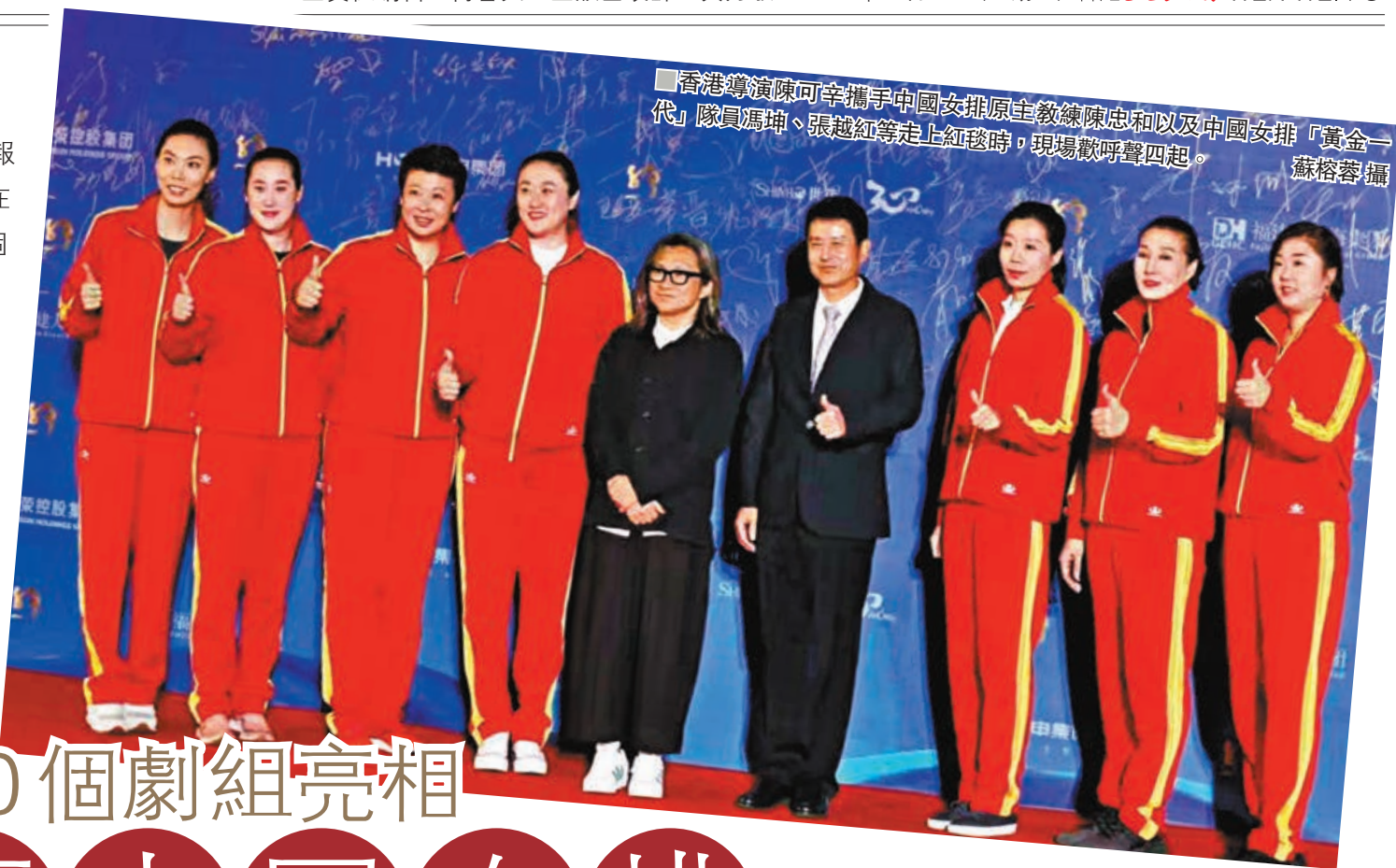
香港導演陳可辛攜手中國女排原主教練陳忠和以及中國女排「黃金一代」隊員馮坤、張越紅等走上紅毯時,現場歡呼聲四起。

香港文匯報訊(記者蘇榕蓉福州報道)第六屆絲綢之路國際電影節日前在福建福州開幕。現場星光熠熠,近20個劇組成員亮相開幕式的明星紅毯儀式。香港導演陳可辛攜手中國女排原主教練陳忠和及原中國女排「黃金一代」隊員、著名導演陳力帶領《古田軍號》劇組、《冰風暴》製片人呂建民攜手福建籍知名女演員張靜初、著名導演李少紅攜《解放·終局營救》劇組,以及來自世界一流交響樂團——匈牙利布達佩斯交響樂團的主要成員在紅毯上亮相。