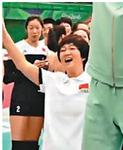
從網上流傳的影片所見，鞏俐扮演中國女排總教練郎平維妙維肖。網絡截圖

香港文匯報訊(記者蘇榕蓉福州報道)第六屆絲綢之路國際電影節日前在福建福州開幕。現場星光熠熠,近20個劇組成員亮相開幕式的明星紅毯儀式。香港導演陳可辛攜手中國女排原主教練陳忠和及原中國女排「黃金一代」隊員、著名導演陳力帶領《古田軍號》劇組、《冰風暴》製片人呂建民攜手福建籍知名女演員張靜初、著名導演李少紅攜《解放·終局營救》劇組,以及來自世界一流交響樂團——匈牙利布達佩斯交響樂團的主要成員在紅毯上亮相。