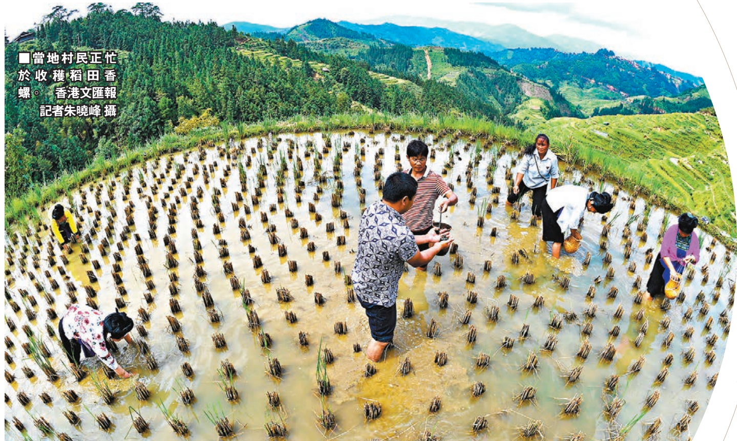
當地村民正忙於收穫稻田香螺。