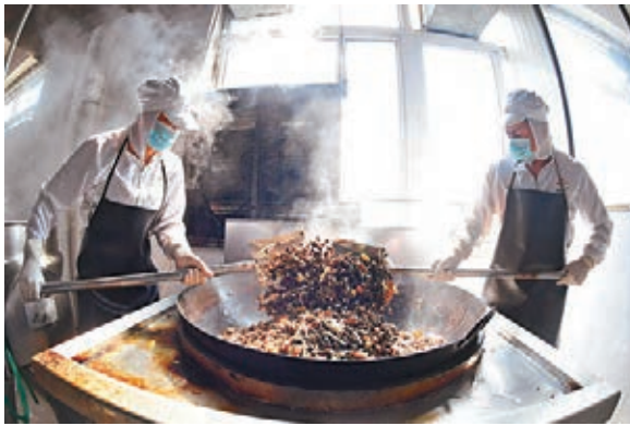
廣西知名特產螺螄粉主要原材料之一螺螄，主要來自融水大苗山。