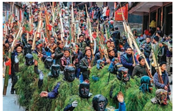
每到農曆正月十七，苗族人舉行儀式迎請山神「芒蒿」，祈求來年風調雨順。香港文匯報廣西傳真

如今，隨着鄉村旅遊的發展，安陞「十七坡」已成為融水極具特色的大型苗族系列坡會之一，「芒蒿」也早已失去原本抵禦山匪的功能，透露着祝福之意的「芒蒿節」吸引越來越多想要「得福」的遊客。