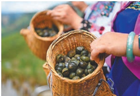
產自融水大苗山的稻田香螺。

白露已過，位於廣西融水苗族自治縣的大苗山臨近中午陽光依然熾熱。幾個苗族女子把三大泡沫箱的香螺抬到一片剛剛收割的香糯稻田的田埂上，用力將香螺拋向稻田中。這些養殖2年左右、腹中孕育眾多螺仔的香螺，從此在這裡落戶安家。香螺是螺螄的一個種類，隨着柳州螺螄粉銷量日增、螺螄需求增多，當地趁勢大力發展養殖香螺，不少民眾因此增收致富。在中國民間故事中，「田螺姑娘」給貧苦的種田人帶來了幸福，而今，香螺同樣給大苗山深處的苗寨人家帶來了脫貧致富的新希望。 ■香港文匯報記者 朱曉峰 廣西報道