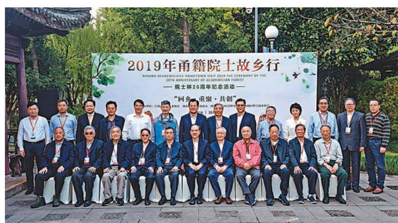
2019年甬籍院士故鄉行。

2018年,寧波經濟總量突破一萬億元人民幣的大關,華潤、華為、中石化、中海油、中石油、中鐵建、中礦、國電投資、國家開發投資、中國中車、中國城通、新希望、萬科、正大、敏實、台碩等世界和中國500強企業都在寧波有大手筆的投資;寧波已經成為央企和外企重點布局的城市。