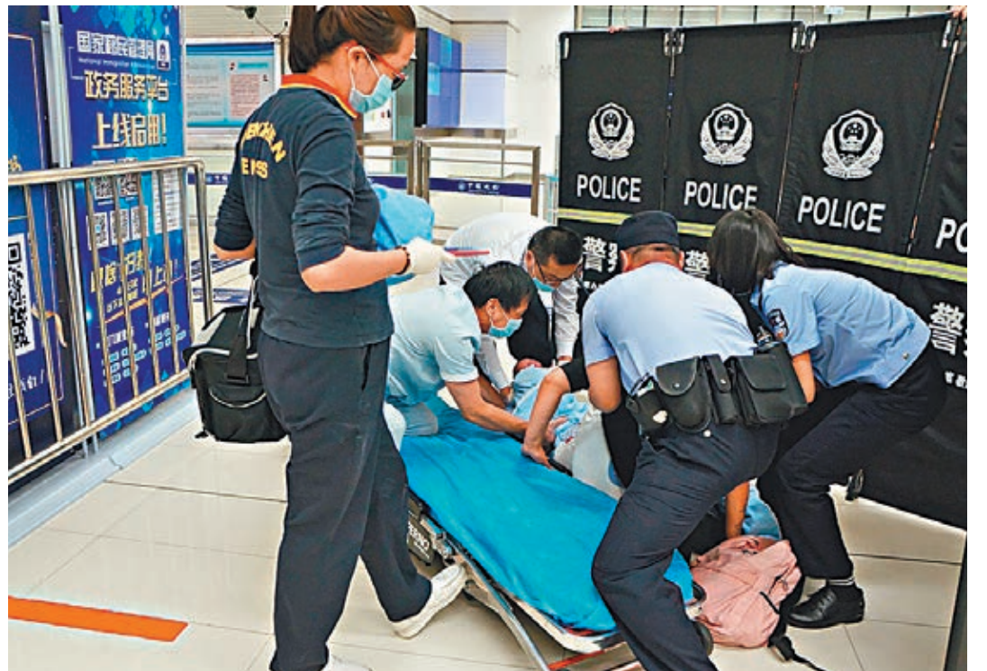
深圳邊檢民警協助120醫護人員幫助BB和港人產婦進行產後處理。

凌晨3時35分,120急救車在皇崗邊檢站警戒隊民警引導下抵達皇崗口岸出境大廳西廣場。醫護人員快速趕至「臨時產房」馬上剪斷BB的臍帶並為產婦進行產後處理,確保母子平安。隨後,執勤民警協助120醫護人員將產婦和嬰兒安全從現場「臨時產房」轉移至120急救車送往醫院作進一步觀察護理。臨走時,產婦眼噙淚花向深圳邊檢民警表示感謝。