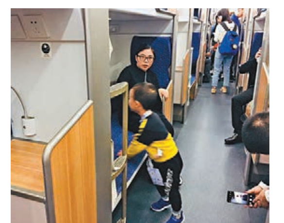
市民爭相體驗高鐵路雙層臥鋪。

周虎告訴香港文匯報記者,本次展示的是商務版本,內飾比較高端豪華,外形採用類似膠囊的設計理念。未來可以根據市場的需求,為客戶提供定製化的設計,大家可以根據自己的喜好,定製屬於自己獨一無二的汽車。