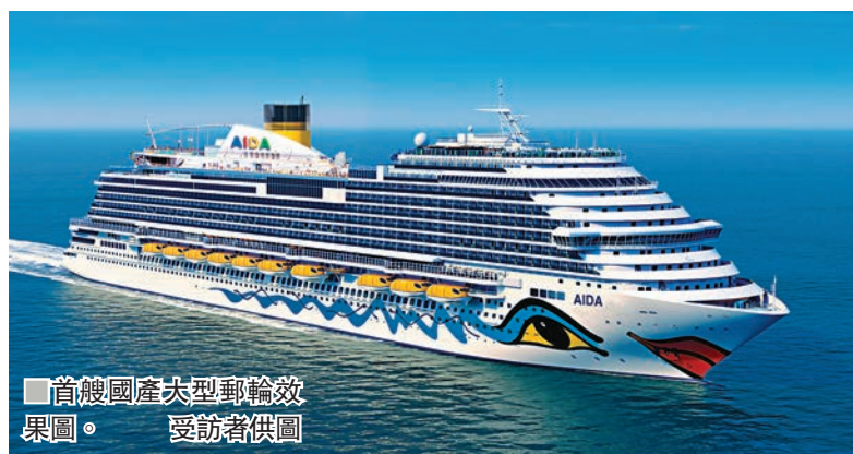
首艘國產大型郵輪於滬開建。

在上線儀式後,即展示了平台於當天接到的首單業務,由東莞某航運公司於中國人財保險簽署的為期一年的船舶保險業務。