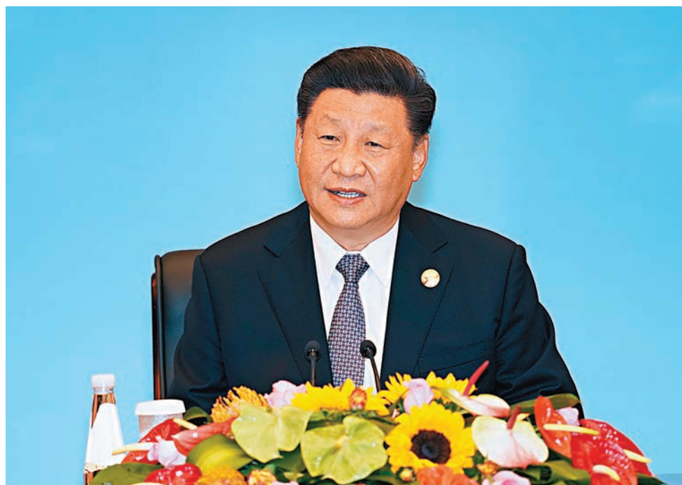
■習近平昨晚出席軍運會開幕式並宣佈運動會開幕。圖為昨天下午習近平集體會見各國防務部門和軍隊領導人及國際軍事體育理事會主要官員。新華社

香港文匯報訊 據新華社報道，第七屆世界軍人運動會18日晚在武漢市隆重開幕。中共中央總書記、國家主席、中央軍委主席習近平出席開幕式並宣佈運動會開幕。18日下午，習近平在武漢集體會見出席第七屆世界軍人運動會開幕式的各國防務部門和軍隊領導人及國際軍事體育理事會主要官員，代表中國政府、中國人民和中國軍隊向出席活動的各國防務部門和軍隊領導人、國際軍事體育理事會官員、各國運動員表示熱烈歡迎。