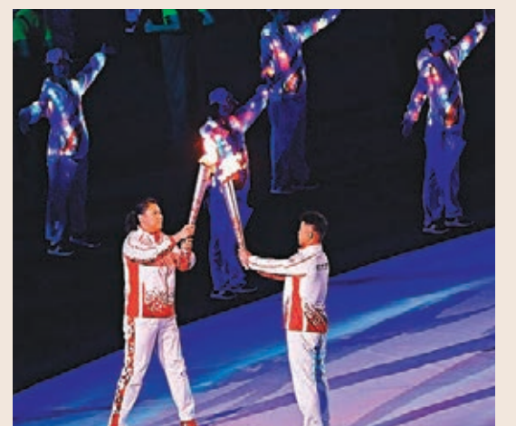
■火炬手傳遞聖火。