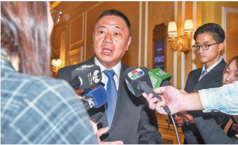
澳門特區經濟財政司司長梁維特強調，澳門政府至今未曾向中央提交任何建立人民幣計價證券市場報告。