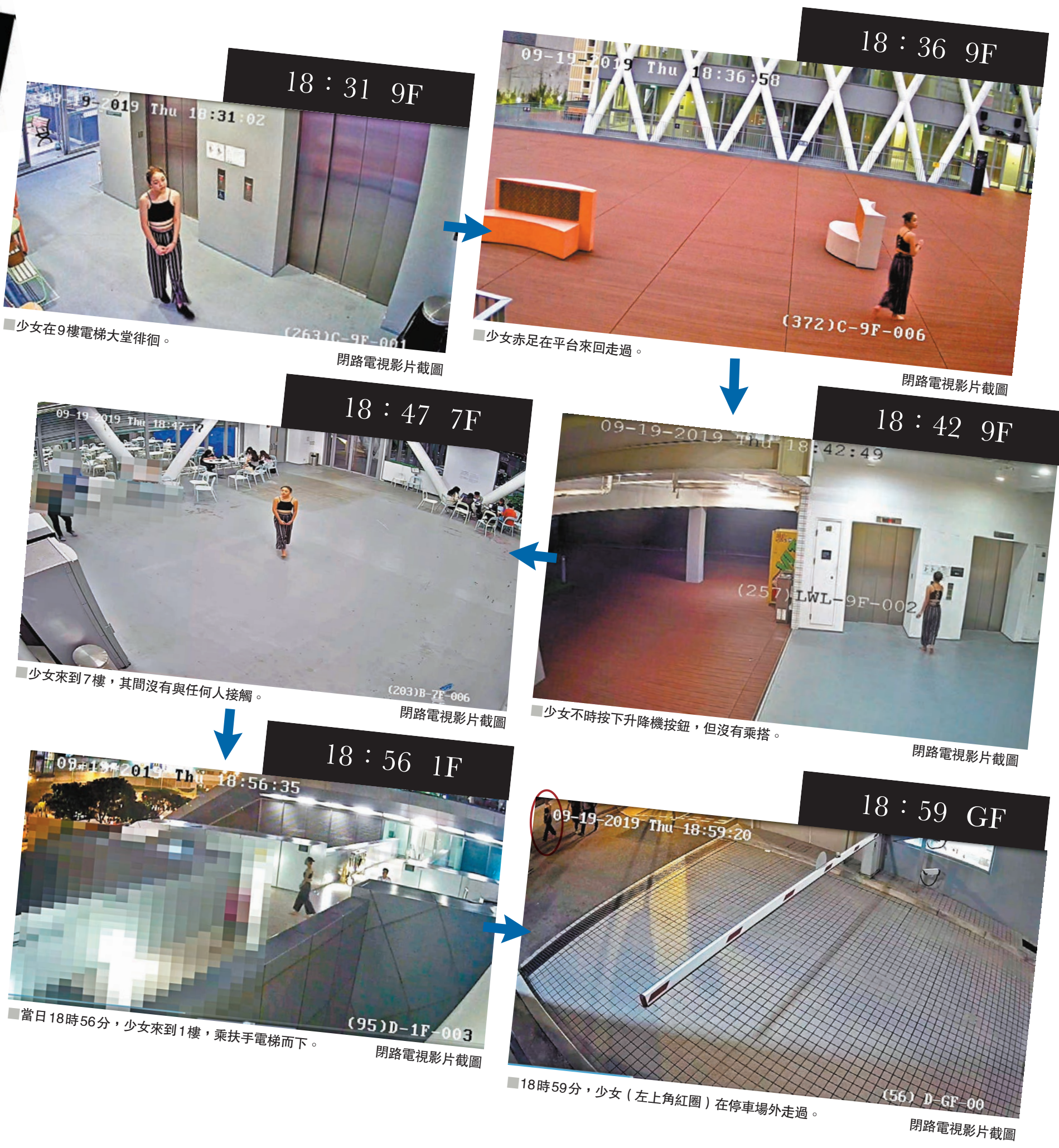
少女在9樓電梯大堂徘徊。

黑衣人暴力思維上腦,只因知專學院未有輕率公開閉路電視影片即連日大肆破壞打爆玻璃及四處塗鴉,導致學院前日起至今日需要停課。雖然校方已經全面展示當日記錄,但他們仍未有收手,更做戲做全套,於停課期間發動「罷課」集會,昨日中午學院再有數十名黑衣、戴口罩者聚集,又在現場獻花、點香,以「悼念」為名繼續肆意消費者、傷害家屬。