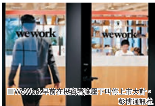
WeWork早前在投資者施壓下叫停上市大計。

上月臨時叫停上市的共享辦公室公司WeWork，因為虧蝕嚴重，為了止血，據傳將會在本周至少解僱2,000名員工，佔員工總數約13%，今後可能還會持續裁員。