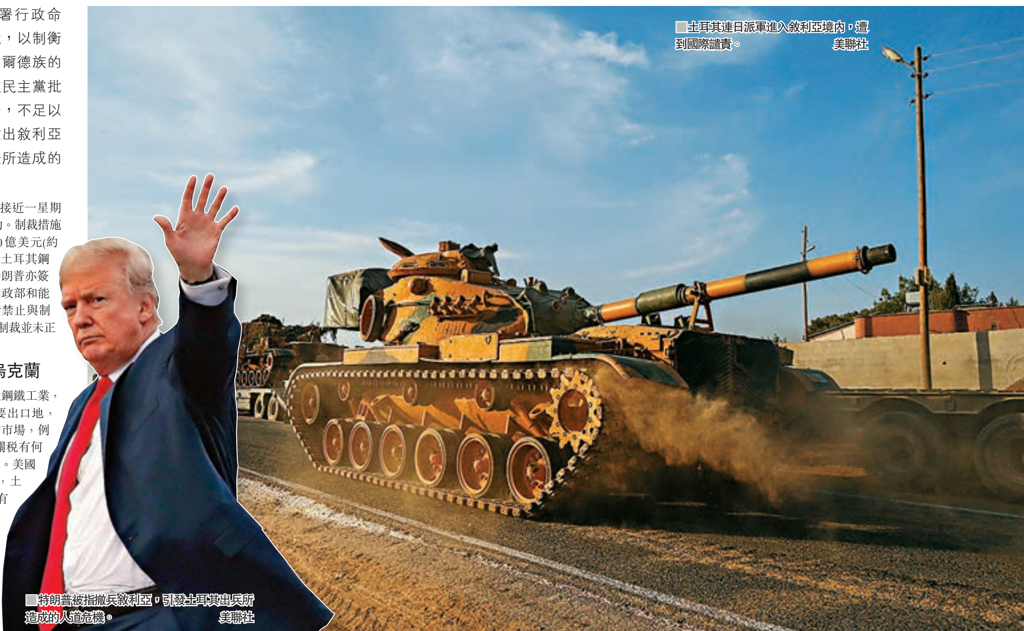
土耳其連日派軍進入敘利亞境內，遭到國際譴責。

特朗普簽署行政命令前，亦與土耳其總統埃爾多安通電話，強烈要求土耳其立即停止在敘北軍事行動，並表示對土耳其的制裁僅僅是開始。埃爾多安日前已經說過，土軍只要再多推進30至35公里，便會結束軍事行動。 ■綜合報道