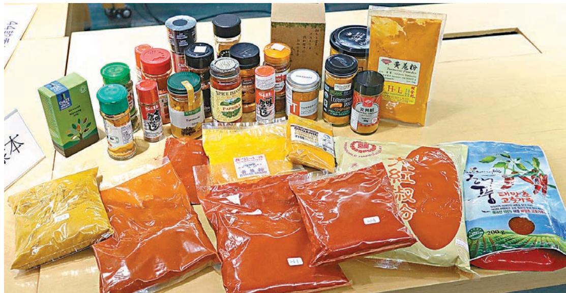
消委會測試市面多款乾香料,發現15款可令人類致癌。

香港文匯報訊(記者 高俊威)為令菜餚色香味俱全,不少人愛在下廚時添加香料。消委會測試市面多款乾香料樣本,發現逾半數含有可令人類致癌及透過胎盤影響胎兒發育的黃曲霉毒素,以及或有機會令人患癌的赭曲霉毒素A。其中兩款香料的黃曲霉毒素總含量超出香港法例要求,已交食物安全中心跟進,另有6款含有毒性較強的黃曲霉毒素B1,最高超出歐盟標準近兩倍。消委會提醒消費者,購買香料時需確保包裝完整及沒有過期,也不宜在雪櫃儲存,開封後應盡快食用完畢。