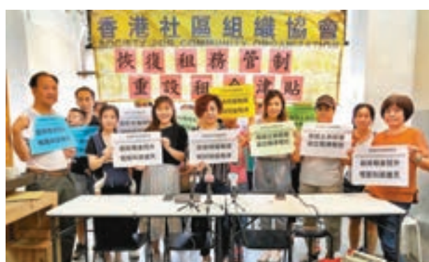
社協公佈深水埗劏房租金調查結果,呎租較私人樓宇單位為高。

消委會提醒消費者決定在網上購物前,應細閱貨品資料頁面內容,釐清有關問題時該向誰交涉。