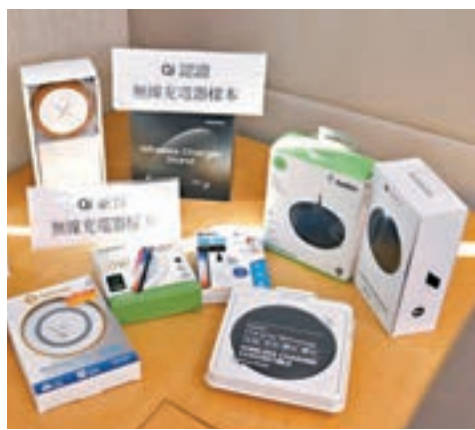
無線充電器整體表現一般。

電,以及可支援的輸入功率;無線充電器的輸出功率愈高,充電速度會愈快,但亦有機會加快電池老化的速度;若手機背部的指環手機支架過厚,又或磁吸手機支架的吸磁片面積太大,或會影響無線充電的效能。