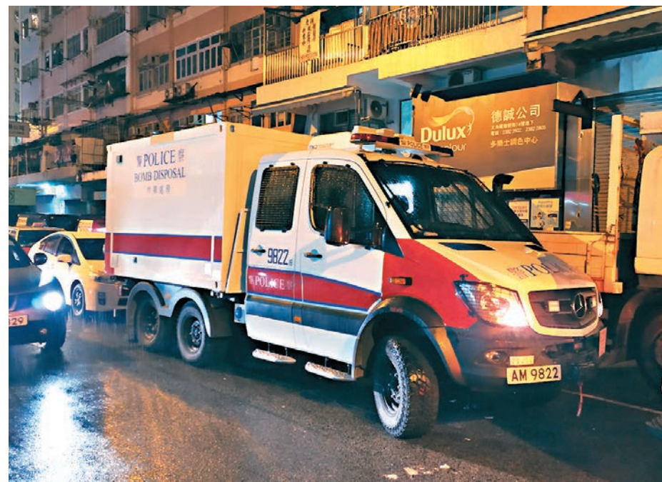
警方爆炸品處理課車輛到場處理。

警務處副處長(行動)鄧炳強本周一(14日)在記者會上狠批暴徒使用土製炸彈襲警,行為殘殘,刑事情報科探員立即蒐集情報,並鎖定目標。 消息稱,該案發生後,警方視為針對警員的「恐怖襲擊」,警員及無辜市民面臨重大危機,炸彈狂徒隨時發動下一輪襲擊,警方