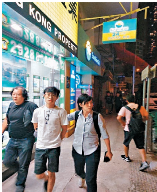
其中一名涉案青年(白衫),由探員押解到大角咀一單位搜證。

香港文匯報訊(記者 蕭景源)黑衣魔10月13日在旺角用手機遙控土製炸彈恐襲警員案,昨晚出現突破性發展。警員昨晚在大角咀街頭截停兩名目標青年,並押解他們到附近一單位搜查時,搜出一批炸彈原材料,警方爆炸品處理課人員聯同毒品調查科人員通宵封鎖現場調查。據悉,被捕兩名青年年約二十餘歲,涉嫌觸犯香港法例第二百九十五章《危險品條例》中管有爆炸品等罪名,警方正全力追緝涉案在逃同黨的下落。