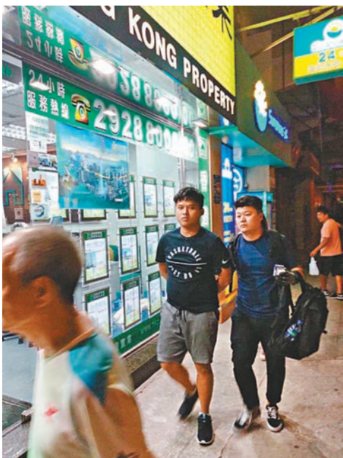
其中一名涉嫌旺角引爆遙控炸彈案的疑犯(左二)由探員押返警署扣查。