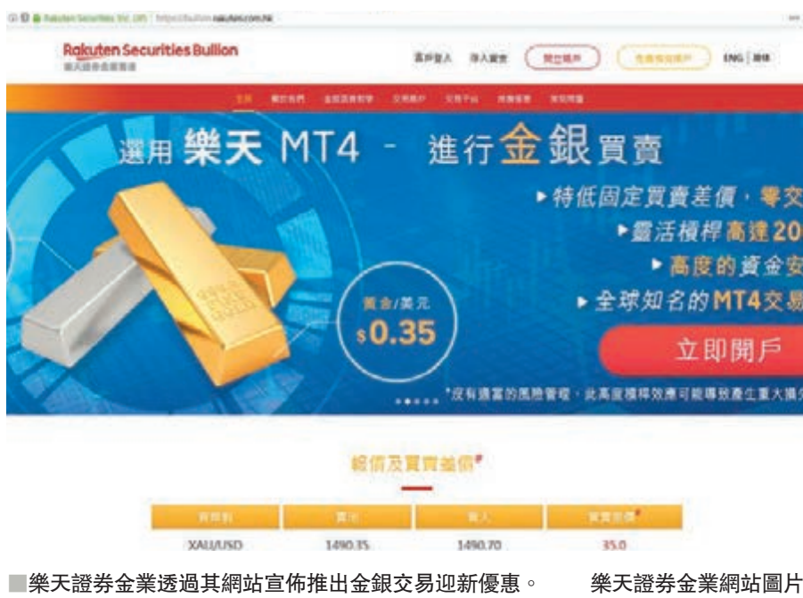
樂天證券金業透過其網站宣佈推出金銀交易迎新優惠。

樂天證券金業董事長飯田和則表示，香港本地市場普遍採用浮動差價，而使用該公司網站的投資者將可受惠於更具競爭力的固定低差價。樂天證券金業的黃金及白銀差價通常分別為0.35美元和0.035美元。