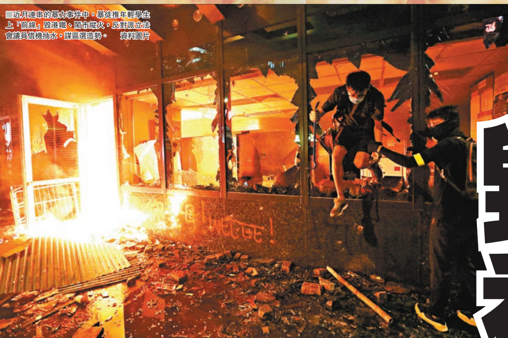
連月連串的暴力事件中，暴徒推年輕學生上前線做暴徒的人肉護盾，毀港鐵、鬧市縱火狂投汽油彈，打砸燒反對暴力的中資銀行、企業、商舖，圍毆持反對意見的市民，「黑色恐怖」瀰漫整個香港社會。一些商舖、小市民為免惹來惡煞而噤聲，但愈來愈多市民勇敢站出來對暴力說不！

不過，在包括反對派立法會議員在內的煽暴派中人眼中，砸毀港鐵、犧牲他人子女的前途、毀他人之間的信任，對己無損，他們非但對暴行視而不見，更上陣為暴徒打氣、阻撓警員執法，並以煽暴文宣繼續鼓吹違法行動。無他，香港越亂，他們就越容易煽動民情，渾水摸魚，以所謂「血債償債」的口號，靠「嚇」、「扮」、「騙」、「抽」、「騙」五招，劍指下月舉行的區議會選舉。從煽暴派反覆無常、見風使舵的計謀不難看出，他們的目的從來不是反對修訂《逃犯條例》草案、不是民主、不是自由，而是選票。在選票面前，年輕人的前途、香港的前途、市民與政府之間的信任、關係每個人的民生，都可以成為炮灰。香港文匯報將推出系列專題，逐一戳破反對派推人拿命搏，自己坐收漁翁之利的醜陋嘴臉，亦向讀者揭示反對派在過去數月的暴力事件中究竟扮演何等角色。 ■香港文匯報記者 文根茂