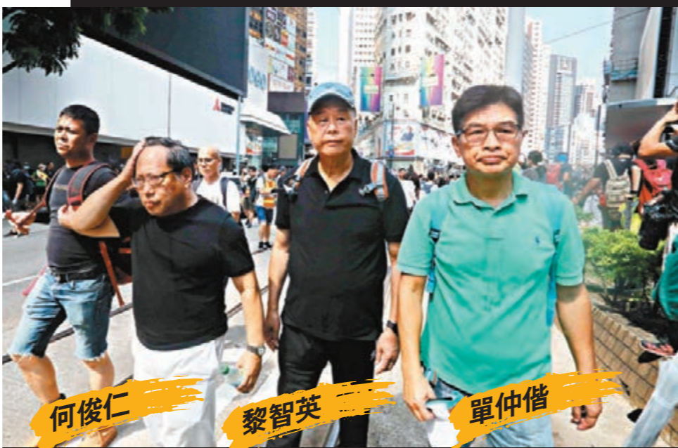
何俊仁 黎智英 單仲偕