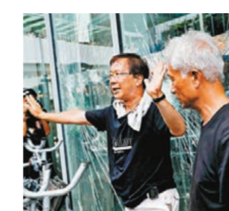
郭家麒和梁耀忠在鏡頭前做足工夫，「勸止」暴徒衝擊立法會。 資料圖片

在7月1日暴徒衝擊立法會的現場，多名反對派立法會議員戲精附體，紛紛衝到前線「勸阻」暴徒在「錯誤時機」的暴力衝擊，企圖在當時爭取「和理非非」的支持。後來，雖然不斷升級的暴力行為，令大多數市民愈來愈反感，更有了混亂和暴力盡快平息的願望，惟有「反」才能有看戲的反對派，為了鞏固極端分子選票，從所謂「勸阻」暴力轉軌為數度高調聲稱「不與暴力割席」、為暴徒遊行辯護甚至鼓吹違法的煽暴派，為選票破壞香港長年建立的法治基礎。