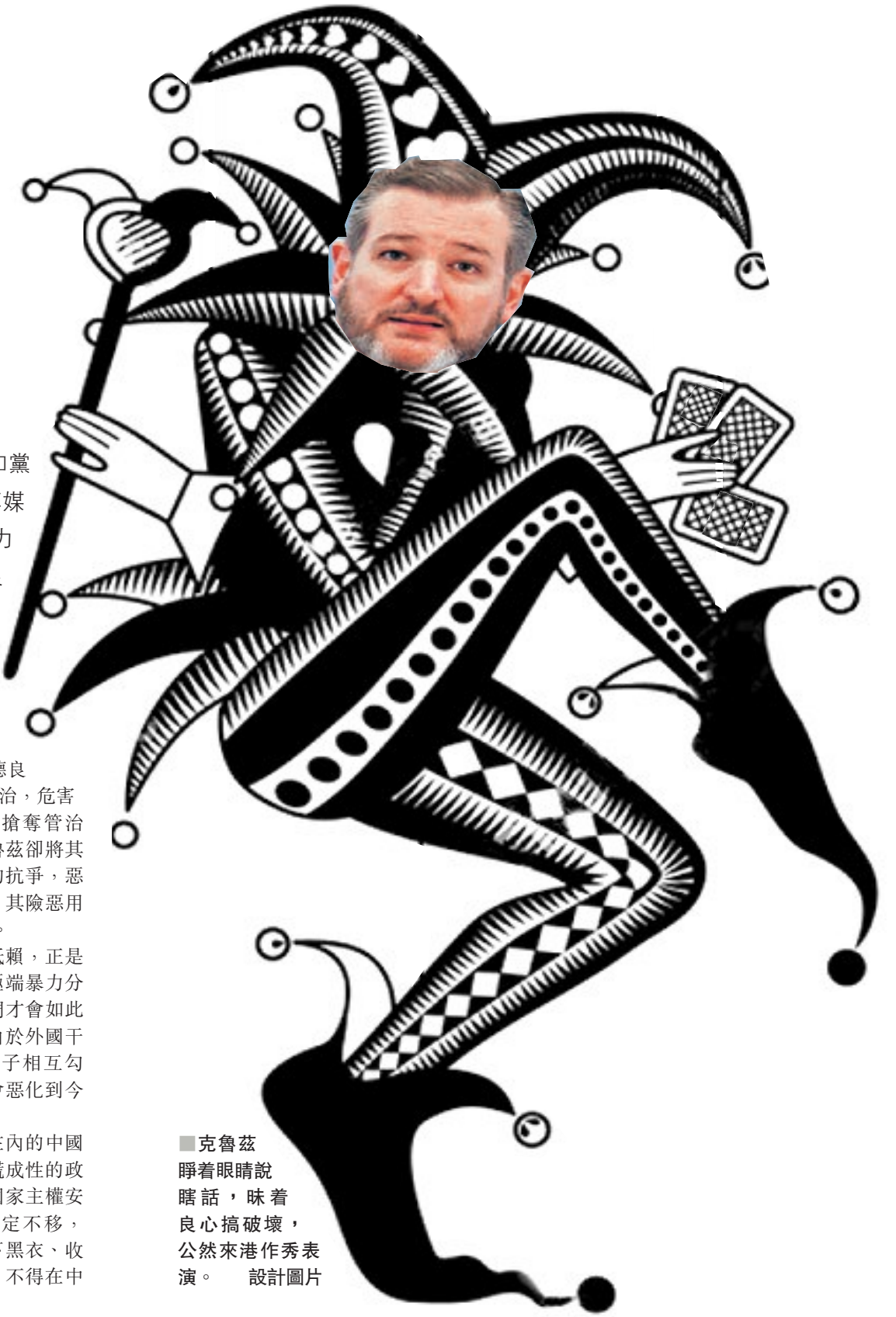
克魯茲睜着眼睛說瞎話，味着良心搞破壞，公然來港作秀表演。設計圖片

卻厚顏無恥地污蔑為「暴力鎮壓」，造謠污蔑之荒謬低劣，已到了令人不齒的地步，喪失了起碼的是非標準和道德良知。面對黑衣暴徒肆意踐踏法治，危害公共安全，企圖以暴力手段搶奪管治權、推毀「一國兩制」，克魯茲卻將其美化為「爭取人權和民主」的抗爭，惡毒詆毀中央政府和特區政府，其險惡用心和卑劣伎倆早已世人識破。 發言人強調：「事實不容抵賴，正是各種外國干預勢力充當香港極端暴力分子的代言人和保護傘，暴徒們才會如此有恃無恐、無法無天；正是由於外國干預的黑手與香港禍國亂港分子相互勾結、狼狽為奸，香港局勢才會惡化到今天這樣令人痛心的地步。」 發言人說，包括香港同胞在內的中國人民堅決反對克魯茲這樣撒謊成性的政客來港尋釁挑事，我們捍衛國家主權安全與香港繁榮穩定的決心堅定不移，「我們要正告克魯茲之流脫下黑衣、收回黑手，停止插手香港事務，不得在中國的土地上撒野！」