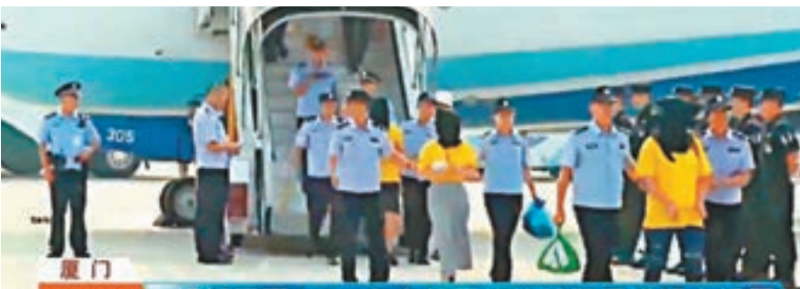
■244名電信網絡詐騙犯罪嫌疑人從菲律賓被押解回國。

公安部對此專門成立打擊整治專項行動領導小組，並組織河北、湖北、福建等地民營成立工作組，赴菲律賓開展警務執法合作，全力偵辦案件。9月11日，工作組會同菲律賓執法部門開展集中統一收網行動，共搗毀詐騙窩點10處，抓獲犯罪嫌疑人244名，繳獲手機、電腦、詐騙劇本、賬本等一大批作案工具、證物。10月11日，上述全部犯罪嫌疑人的被警方押解回國。