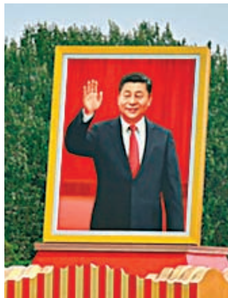
■習近平總書記畫像。