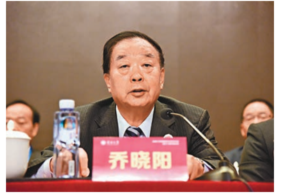
喬曉陽會上強調，「一國兩制」實踐必須也只能建立在於法治的基礎上。 深圳傳真

國務院港澳辦副主任鄧中華則對中心提出三個期待：要切實加強研究工作，積極服務國家發展戰略；要圍繞港澳工作與粵港澳大灣區建設，深入研究一個國家、兩種制度、三個地域、多元文化、高度自治等之間的複雜關係以及存在的法律挑戰；要深入宣傳推廣憲法和基本法，不斷強化對基本法的正確理解，共同維護憲法、基本法的權威和尊嚴。同日，深圳大學還舉行了「一國兩制法律文獻特藏室」揭牌儀式。