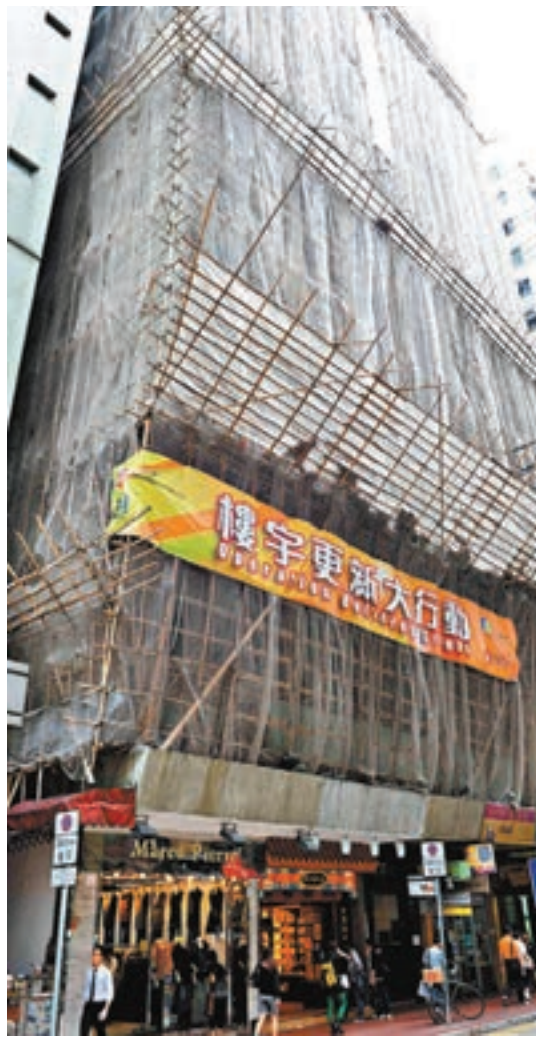
政府宣佈增撥合共105億元予現有的四項樓宇安全及復修資助計劃。 資料圖片

香港文匯報訊（記者 成祖明）本港樓宇日漸老化，復修工程刻不容緩。為減輕業主的經濟負擔，政府昨日宣佈增撥合共105億元予現有的四項樓宇安全及復修資助計劃，包括：樓宇更新大行動2.0、消防安全改善工程資助計劃、優化升降機資助計劃及長者維修自住物業津貼計劃，並放寬計劃的申請資格，最快今年年底諮詢立法會，爭取明年上半年獲批撥款，使建築物符合法例要求，保障公眾安全；同時也為目前開工不足的建造業工人提供就業機會。