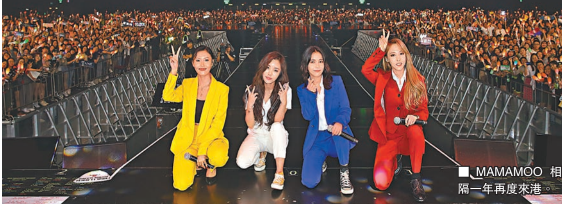
MAMAMOO 相隔一年再度來港。