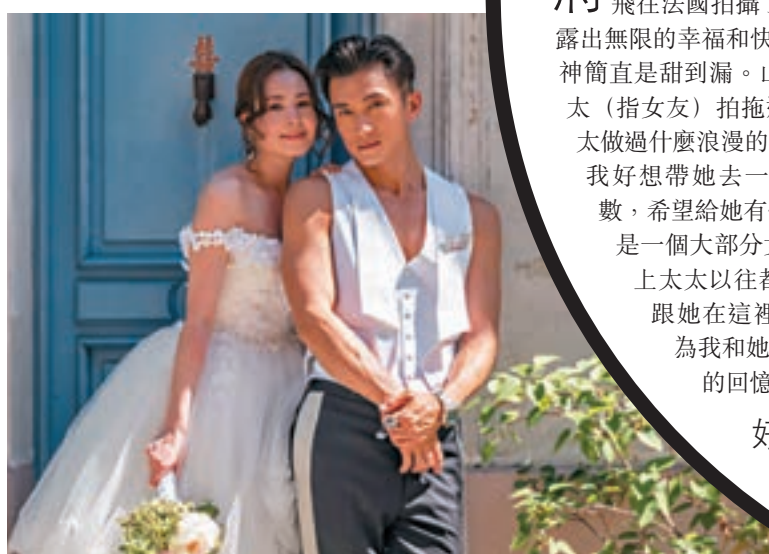
一對準新人將於11月1日舉行婚禮。

將迎接人生大事，早前山聰與Apple特別飛往法國拍攝了婚紗照，照片下兩人流露出無限的幸福和快樂，山聰望着Apple的眼神簡直是甜到漏。山聰表示：「其實我跟太太（指女友）拍拖這5年裡邊，我都沒為太太做過什麼浪漫的事，現在終於要結婚了，我好想帶她去一個好浪漫的地方影相補數，希望給她有個美好回憶。我相信法國是一個大部分女仔都會喜歡的地方，加上太太以往都未去過法國，所以好想跟她在這裡影一輯靚靚婚紗相，成為我和她之間一個最美好、最難忘的回憶。」