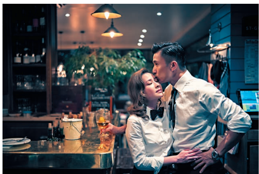
影一輯靚靚婚紗相，為二人留下最美好的回憶。