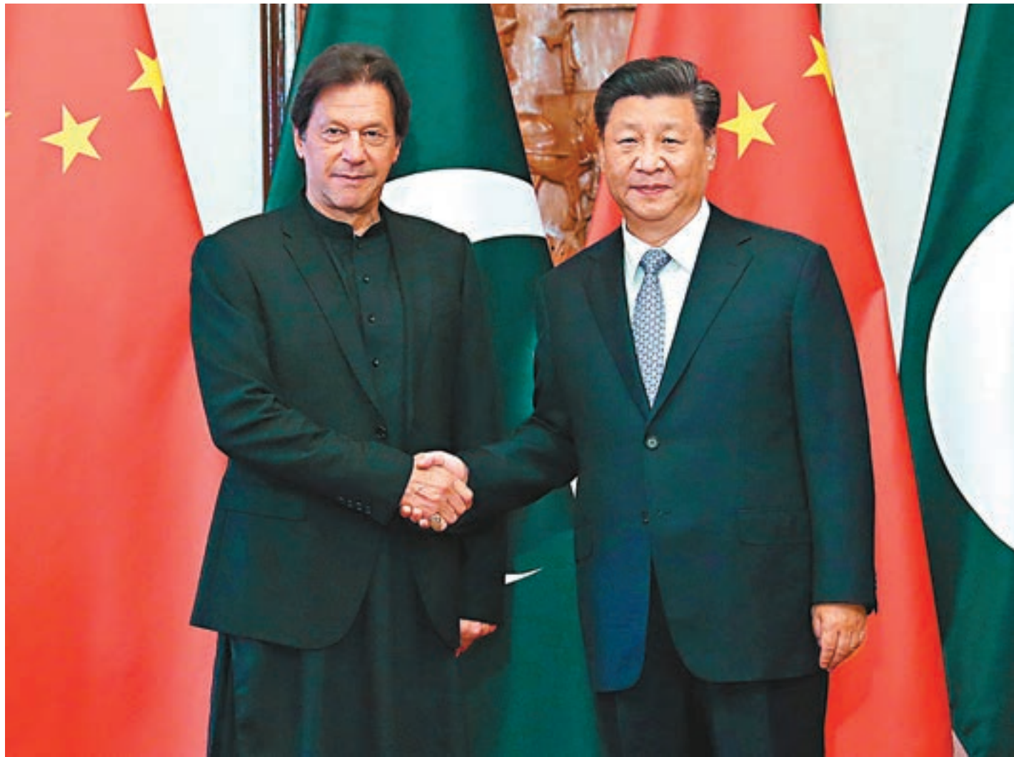
昨日，習近平在北京釣魚台國賓館會見巴基斯坦總理伊姆蘭·汗。

伊姆蘭·汗介紹了巴方對當前克什米爾局勢的看法，呼籲盡力避免事態惡化，防止局勢失控，表示巴方高度重視和讚賞中方所持的公正客觀立場。習近平表示，中方關注克什米爾局勢，有關事態的是非曲直是清楚的，中方支持巴方維護自身合法權益，希望當事方通過和平對話解決爭端。