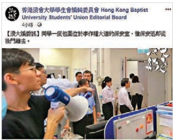
學生硬闖保安室。

香港文匯報訊(記者 余韻) 日前警方在九龍塘追捕示威者時，一度進入浸大校園範圍，其後於校外的公眾行人路拘捕5名浸大學生。浸大學生會惡人先告狀無視被捕學生違法在先，昨日聚集逾百名的口罩黑衣人遊行，稱大學保安沒有阻止警員進入校園，又強闖保安室要求解僱涉事的兩名保安。其無理取鬧行徑引來網民批評行為為自私自利，「唔尊重人地意見但要聽從他地意見。」惟保安公司卻詭稱兩名保安「反應不足」，已終止其於浸大的工作並發警告信。