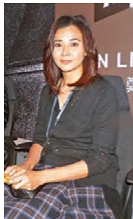
離巢五年，蒙嘉慧對復出拍劇極之重視。