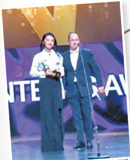
姚晨上台稱希望劇集《都挺好》能盡快和其他國家的觀眾見面。