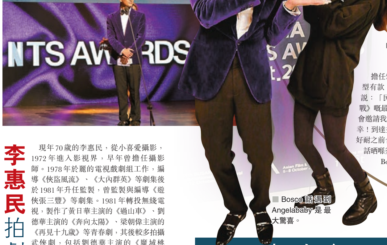
Bosco獲大會邀請擔任頒獎嘉賓。