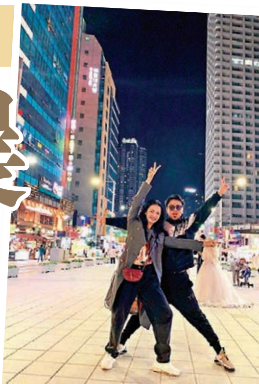
雷佳音和姚晨在釜山街頭興奮合影。

Bosco由於要在台上講話，為了尊重大會，他決定以韓文發言，事前一晚狂練韓文，雖然心情緊張，但最終表現有板有眼，順利完成，贏得全場掌聲，