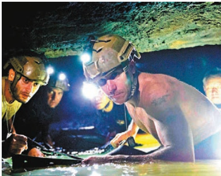
泰國少年足球員和他們的教練去年逃出洞穴的經歷拍成電影。

Tom Waller將這部電影的重點擺在救難過程，而非受困的師生，因為這些人已和美國Netflix簽訂影集翻拍合約。他表示：「有許多搜救細節還未真正對全球曝光，例如孩子的鎮定態度和救難人員的背景。」