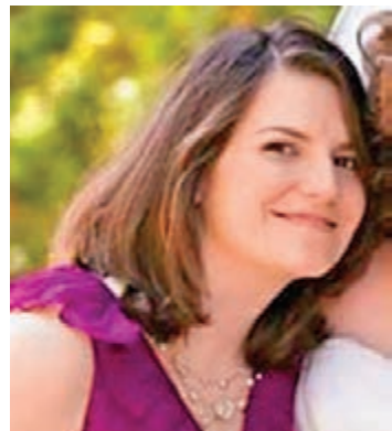
網上流傳為薩科拉斯的照片。