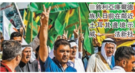
敘利亞庫爾德族日前在鄰近土耳其邊境示威。

土耳其政府與庫爾德族的恩怨長達近一世紀，庫族一直指控受政府迫害，引發持續不斷的流血衝突。總統埃爾多安上台後，曾承諾改變對庫族的政策，但只是曇花一現，最終大力清剿國內的庫族勢力，更揮軍攻擊在敘利亞和伊拉克境內的庫族部隊，造成逾3,000人死亡。