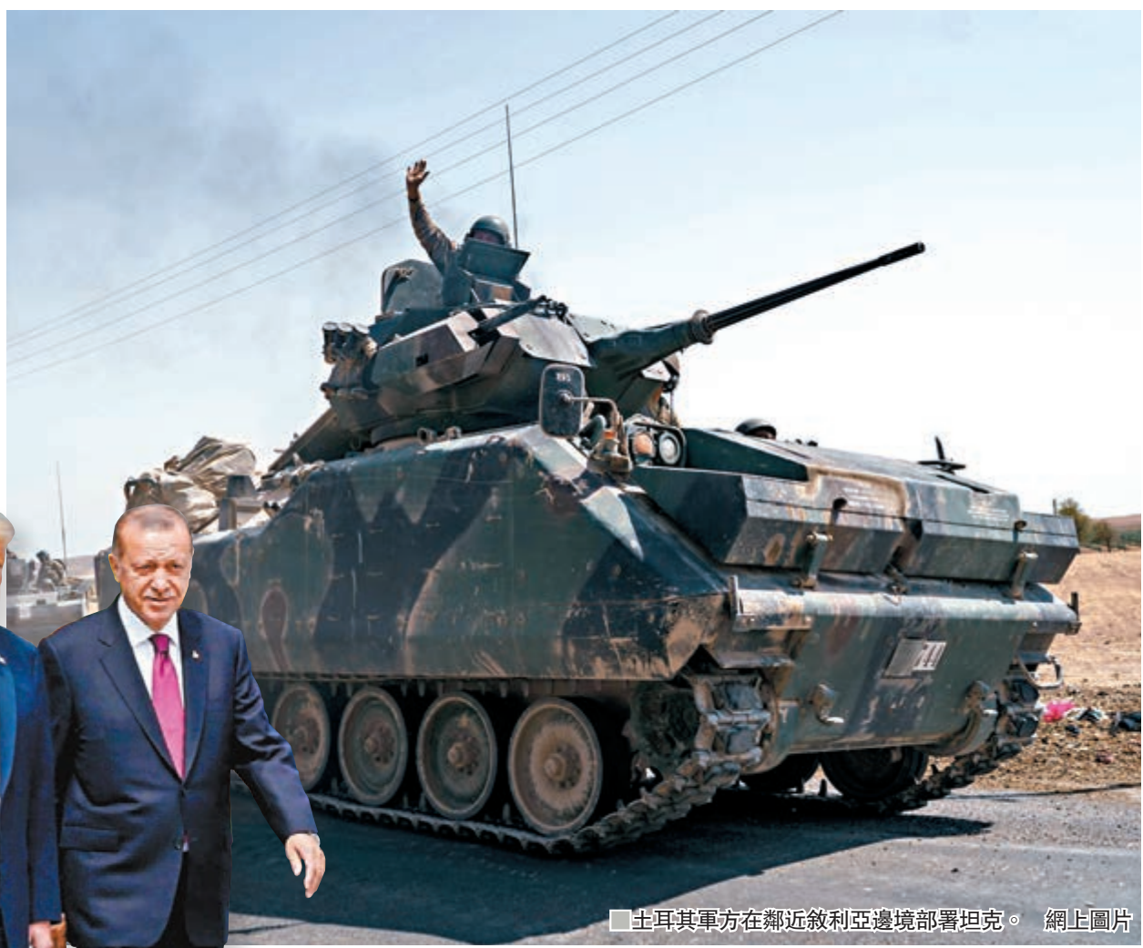
特朗普和埃爾多安