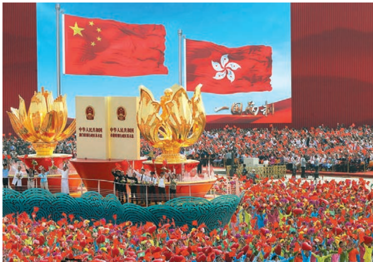
國慶典禮上的「一國兩制」方陣。