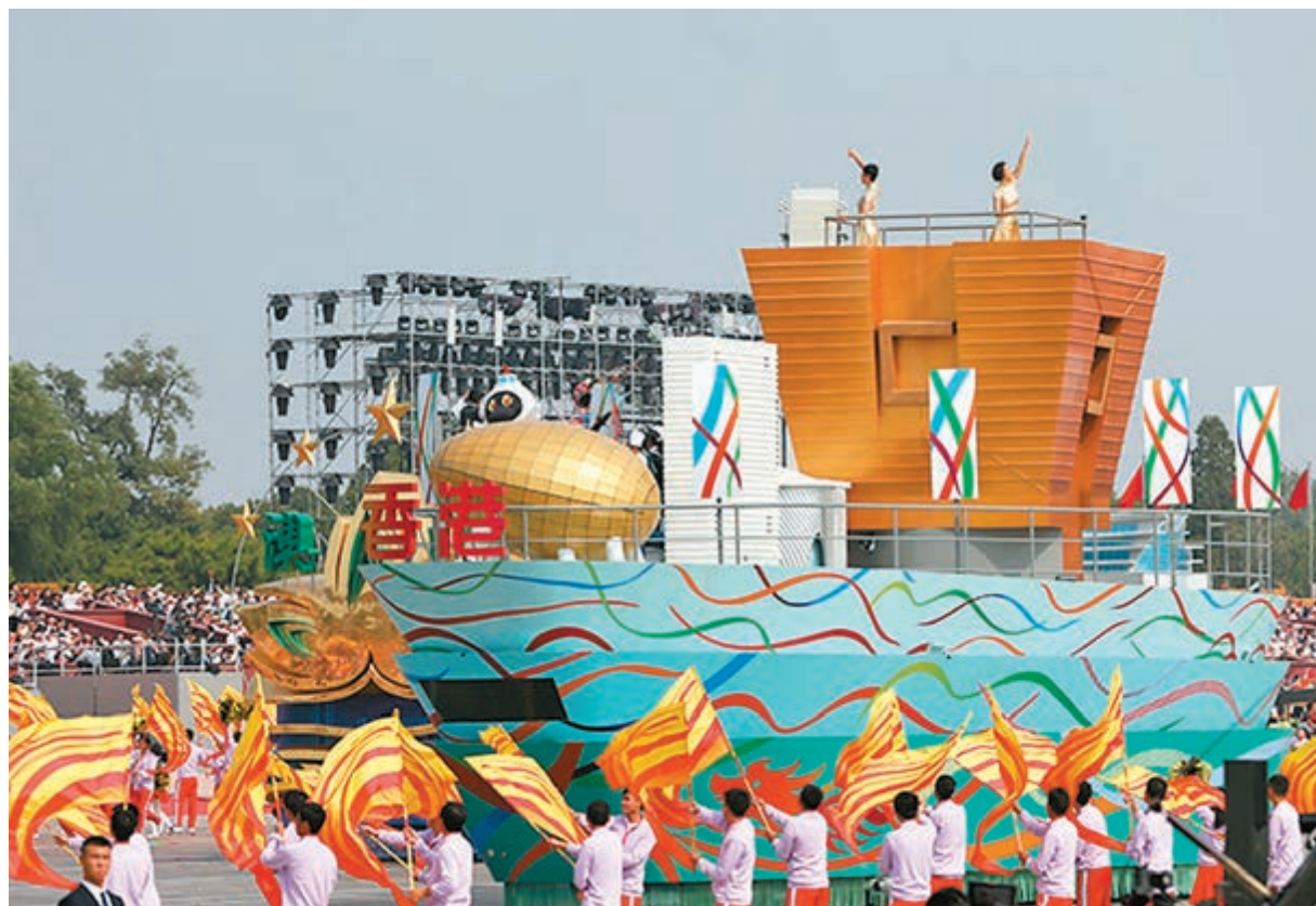
國慶典禮上，香港特區彩車通過天安門。