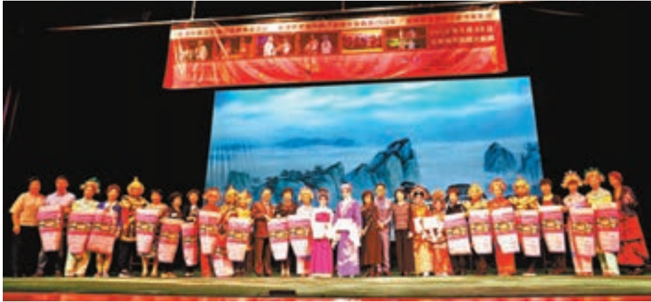
廠商會婦委會「25周年慈善折子戲」圓滿舉行。

香港文匯報訊（記者 子京）香港中華廠商聯合會（廠商會）屬下婦女委員會（婦委）日前夥拍鳴芝聲劇團假新光戲院大劇院舉行「25周年慈善折子戲」，吸引超過1,000位善長仁翁及粵劇戲迷支持捧場。