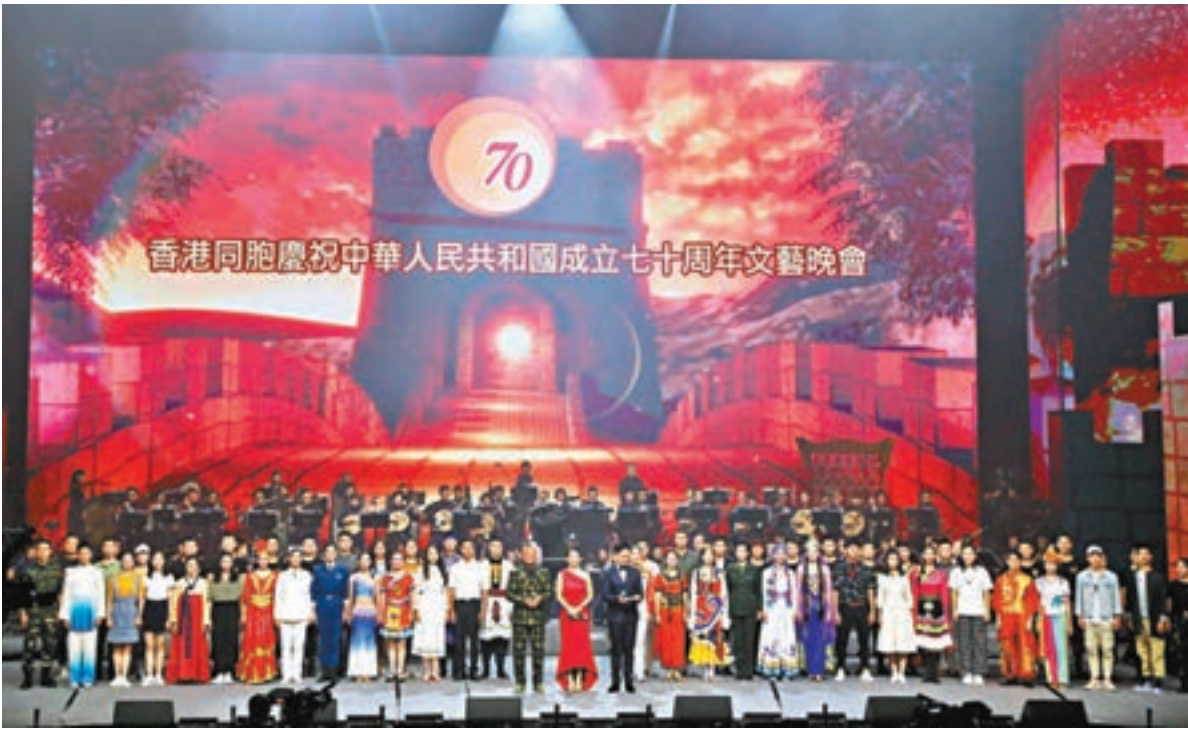
「香港同胞慶祝中華人民共和國成立70周年文藝晚會」順利舉行。