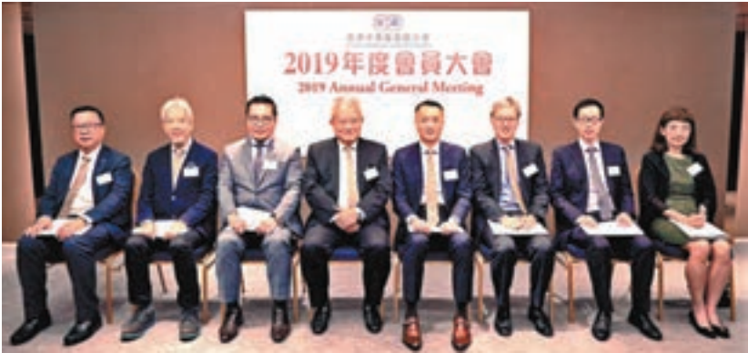
廠商會舉行2019年度會員大會，賓主合照。

同時間，近月連串的暴力示威事件嚴重影響本地的商業運作，打擊零售市場和向外來投資者的信心；而訪港旅