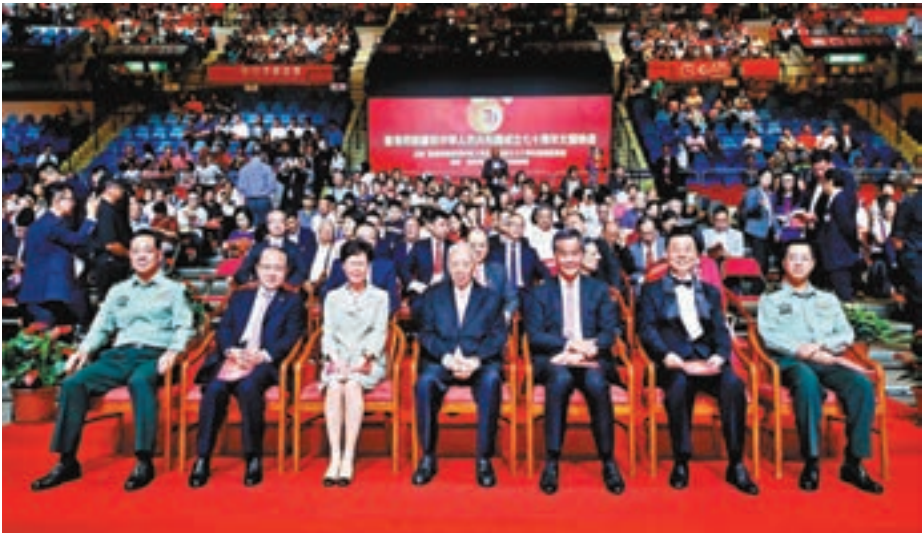
董建華、梁振英、林鄭月娥、王志民、謝鋒、陳道祥、蔡永中等出席晚會。

今年為新中國成立70周年大慶，舞台設計別出心裁，採用多塊屏幕及視覺效果，將萬里長城宏偉地呈現，配合舞台的升降設計及燈光、煙火效果，演出幕幕精彩，令人目不暇接。