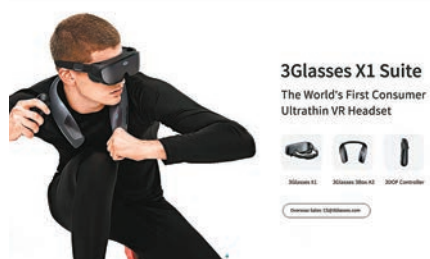
■3Glasses今年推出新一代超薄VR眼鏡系列「X1」。

目前，X1已成功實現和中興天機Axon 10Pro 5G版機型的直連，用戶僅需通過X1自帶的標準Type-C數據接口，便可連接移動設備，體驗3DOF自由度的虛擬實境內容——這標誌着X1成為全球範圍內首度達成與5G手機直連的可量產超薄VR眼鏡，更是對手機搭載虛擬實境產品的無限拓展屏的率先創新；與此同時，預示着這一有機結合有望延伸至手機配件的開發方向之一。