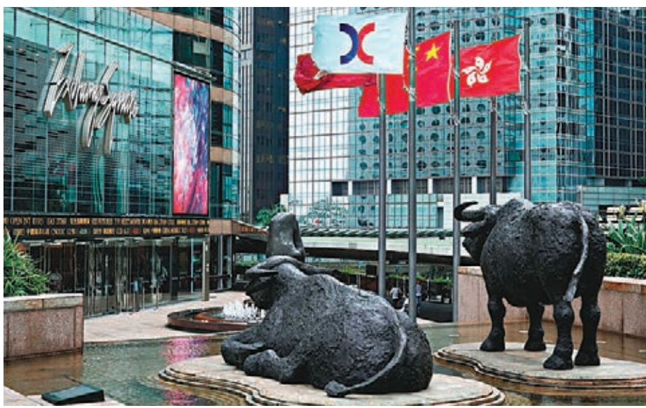
■甫踏入第四季傳統旺季，多隻新股已排隊上市。

香港文匯報訊(記者 莊程敏)新股市場步入第四季傳統旺季，多隻新股計劃招股。路透社引述消息指，裝配式建築解決方案供應商長沙遠大住宅工業集團正尋求本周通過上市聆訊，計劃集資2億至3億美元(約15.6億至23.4億港元)。另外，內地小家電企業JS環球生活亦開始香港IPO預路演，計劃集資5億至6億美元(約39億至47億港元)；康德萊醫療器械亦正尋求本周通過上市聆訊，擬集資1億美元(約7.8億港元)。