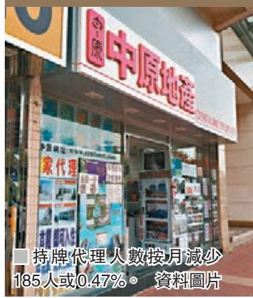
持牌代理人數按月減少185人或0.47%。資料圖片

香港文匯報訊(記者 顏倫樂)樓市近期交投減少,代理生計大受影響。地產代理監管局資料顯示,截至9月底持牌代理人數為39,589人,按月減少185人或0.47%,已連跌兩個月,並且是去年7月後14個月的低位。資料顯示,9月整體物業註冊量約有4,088宗,較8月5,159宗下跌20.8%,創9個月新低,以最新代理人數計算,即平均近10名代理爭1張單。局方資料顯示,39,589位持牌代