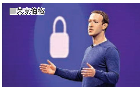
美國科技新聞網站The Verge前日根據社交媒體facebook(f)員工大會流出的錄音片段報

道，顯示行政總裁朱克伯格回應民主黨總統初選參選人沃倫倡議分拆fb，強調將循法律途徑抗爭到底。