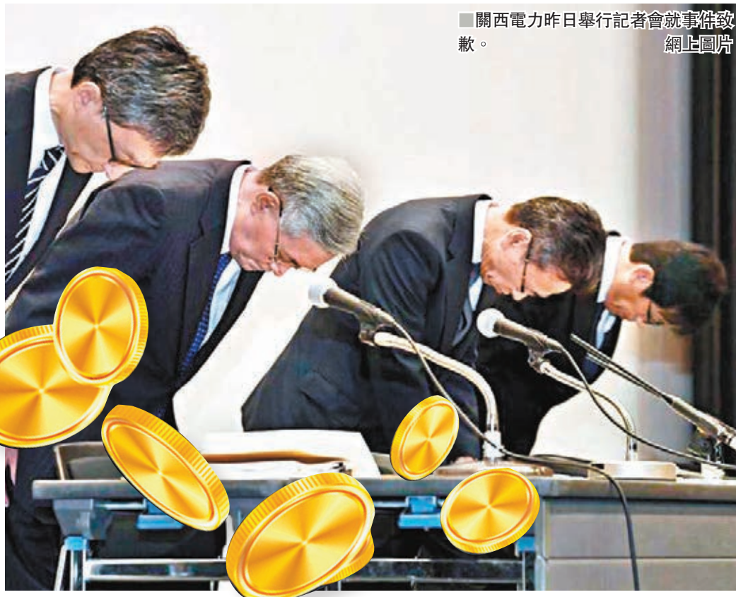
關西電力昨日舉行記者會就事件致歉。