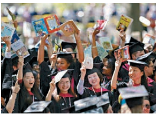
哈佛稱其收生制度行之有效及合法。網上圖片