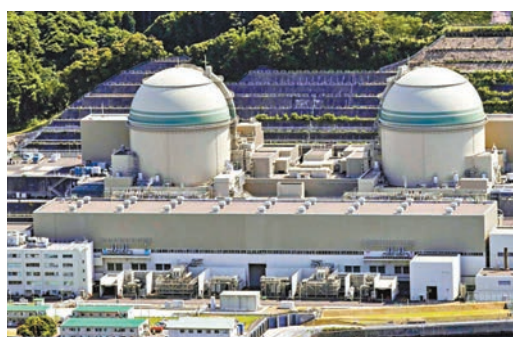
事件令外界關注核電站安全。圖為關西電力在高濱町的核反應堆。

日本於2011年發生「311」大地震，引發福島核電站洩漏輻射災難，政府其後關閉全國大部分核電站的反應堆，並在近年陸續重開。不過，關西電力高層今次爆出貪腐醜聞，勢必打擊公眾對當局核電政策的信心，可能要求進行更嚴格審查，令部分核反應堆重開無期。