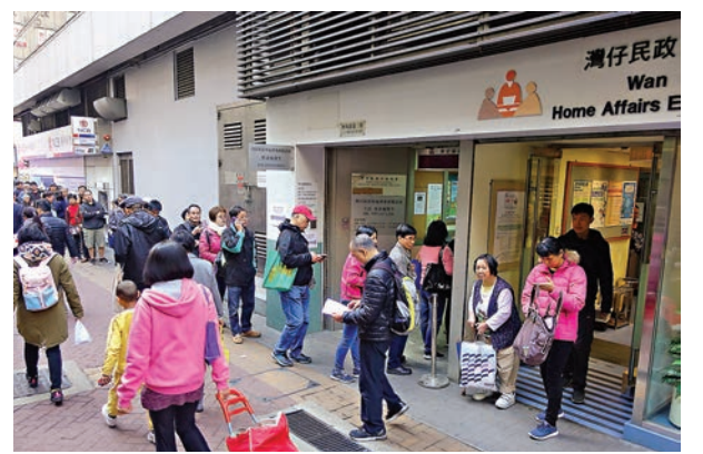
■1.2萬份關愛共享計劃申請表疑遺失。

特區政府去年在2018/19年度財政預算案中提出「關愛共享計劃」，符合申請資格的市民，每人可申領4,000元或扣減相關薪俸稅款寬減額及/或差餉寬減額後的差額。