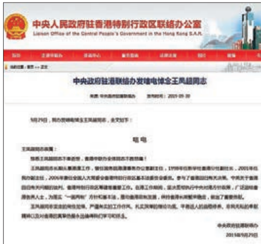
■中聯辦發唁電悼念王鳳超。