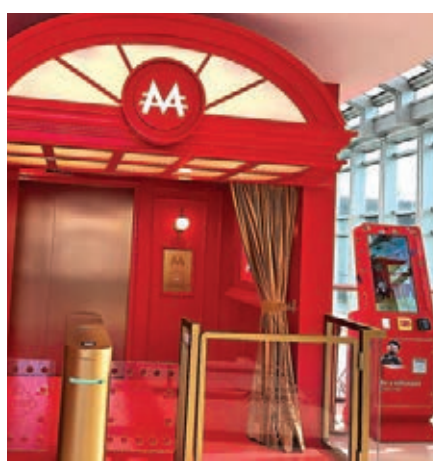
▲夢想世界入口處。▼神秘大宅。

Pass Go 霓虹燈隧道，就會進入大富翁市鎮，市鎮裡有火車站、水務局、監獄、夢想地產、超級銀行和金庫等場景，立體化還原遊戲元素和關卡，「打卡」拍照之餘，玩家還可以玩「捉拿小偷」、「找不同」等小遊戲。 在電子銀行場景裡，玩家可以進入一個透明玻璃房，在20秒內，盡量多地抓取從天而降的「紙幣」，這些「錢」可在大富翁禮品店和小食店當作等額的現金使用。 離館前最後一站，是一個命運轉輪機，轉輪停時，玩家可以獲得指定的商家禮券，如果轉輪指針轉到特別格，還有機會參與大獎競猜，中獎者將獲得1公斤重的純金大富翁棋子，僅金價超過40萬港元，加上手工和紀念意義更是物超所值。 大富翁夢想世界運營總監陳景邦介紹，場館將全年無休開放，營業時間為早10時至晚10時，遊客可以通過網上和即場購票，成人票價為260元。 為保證參觀體驗，每張門票印有獨特二維碼，遊客可掃二維碼參與場內遊戲，館方亦會通過二維碼管理入場人流，同一時間場館大約可容納120人。